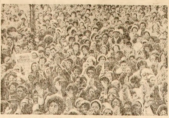
Demonstrația la Washington pentru majorarea prevederilor bugetare privind programele sociale.

PHENIAN (Agerpres). — Simbătă a sosit la Phenian, într-o vizită de bună înțelegere, șeful statului cambodgian. El este însoțit de Ir Sen, președintele Republicii Populare Democratice Coreene.