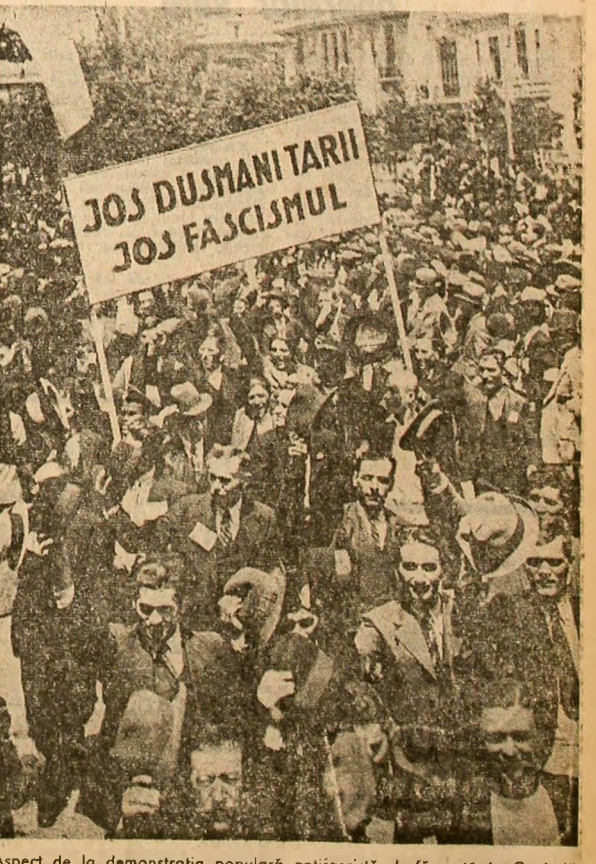
Aspect de la demonstrația populară antifascistă desfășurată în Capitală la 31 mai 1936.

O parte numai din aceste dezerdate purtate în prolap de țărani