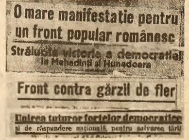
Facsimilele a unor titluri apărute în presa vremii

Justețea orientării P.C.R. spre unirea într-un front larg a forțelor democratice, progresiste, patriotice și-a găsit o vîie confirmare în alegerea parlamentare parțiale, desfășurate în 1936, în județele Hunedoara și Mehedintii. Represuniile polițienești, imbinată cu provocările bandelor legionare, nu au putut împiedica masele populare să voteze pentru forțele democratice care, prezentîndu-se unite în alegeri, au ieșit învingătoare în ambele județe, obținînd la Hunedoara 31 965 voturi (cu peste 7 000 mai mult decît candidatul partidului liberal, alături la guvern, și cu 25 000 mai mult decît candidatul grupării ciziste), iar la Mehedintii — 20 867 voturi (cu aproape 3 000 mai mult decît candidatul cizist). „Hunedoa-