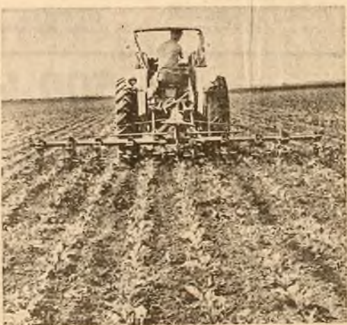
Prășitul mecanic al sfeclei de zahăr la cooperativa agricolă de producție Traianu, județul Ialomița