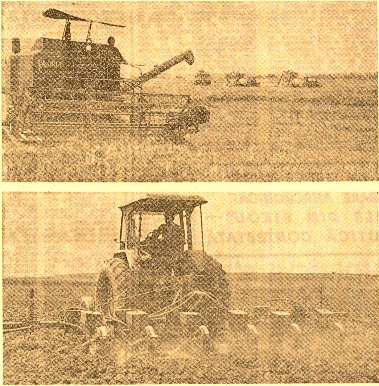
Doă lucrări care trebuie executate în flux continuu: recoltarea cerealelor şi semănarea culturilor doale pe terenurile liberate...

Emilian ROUĂ, corresponsentul „Scînteii”