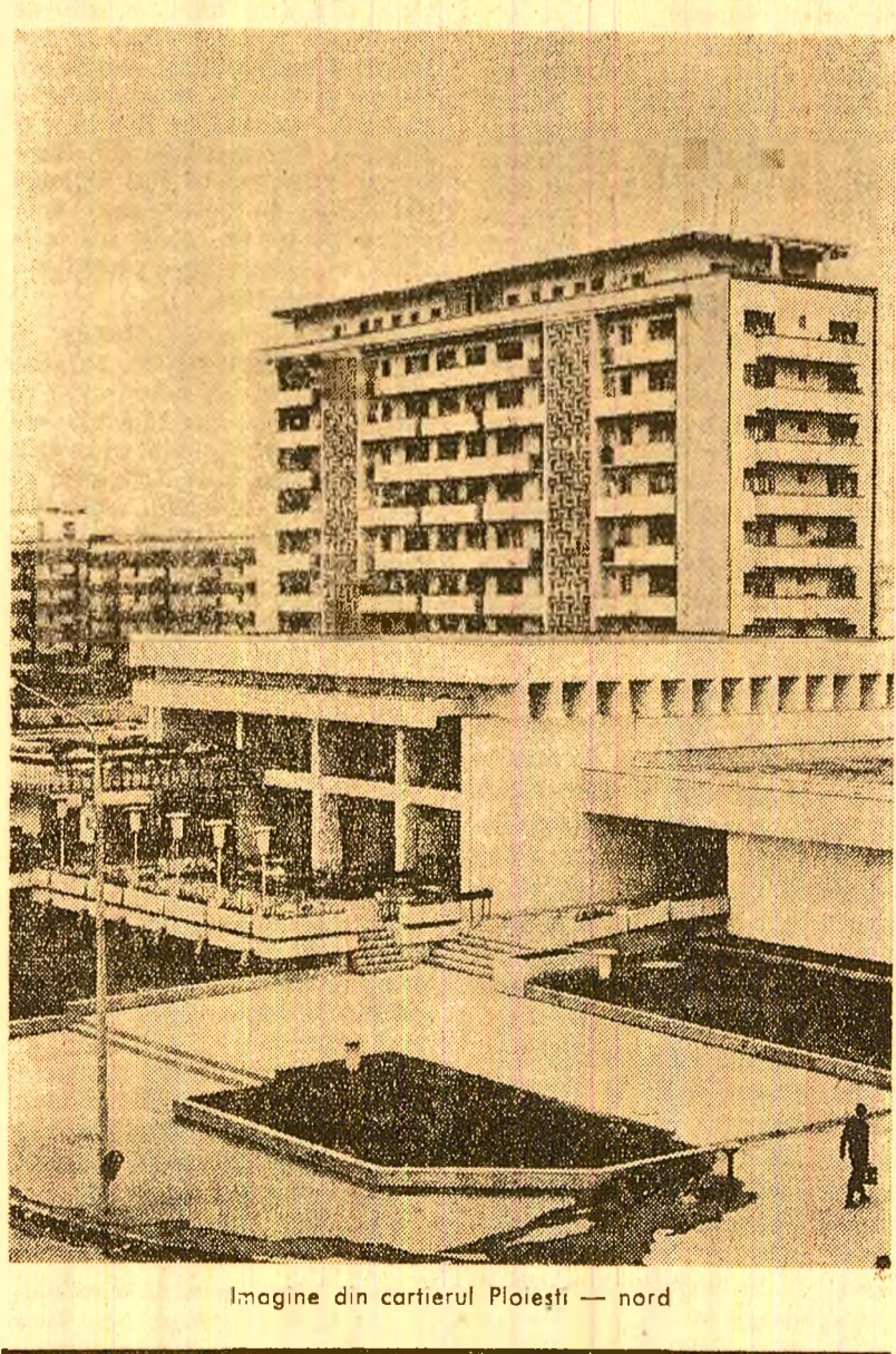
Imagine din cartierul Ploiești — nord

Rubrică redactată de Dumitru TIRCOB și Gheorghe DAVID și corespondenții „Sciinteia”