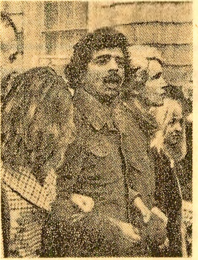
Demonstrație de protest la Londra împotriva vizitei premierului portughez, Marcello Caetano

tarea exporturilor de cereale ale țărilor membre ale Pieței comune, precum și acțiuni menite să încurajeze diversificarea producției agricole vest-europene în scopul slăbirii dependenței la importurile unor categorii de produse agricole din S.U.A., cum este cazul la soia și semințele oleaginoase.