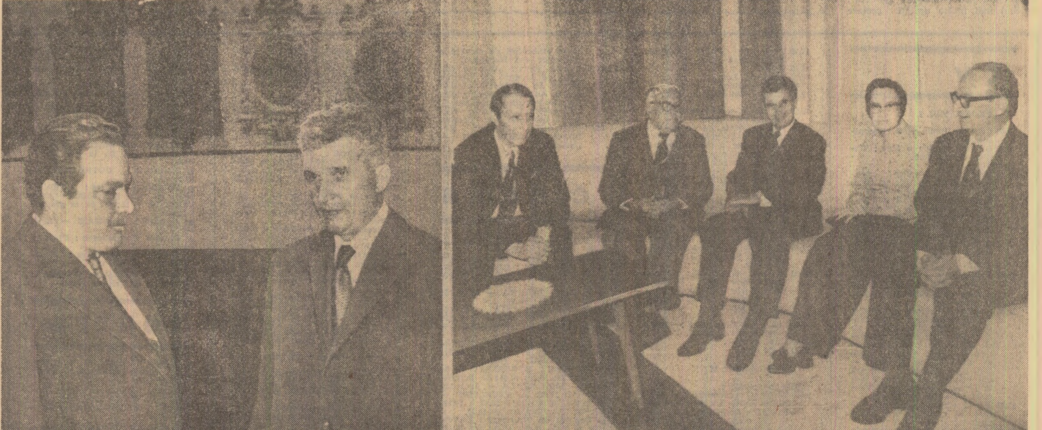
În timpul întîlnirii cu Luis Alberto Monge, secretar general al Partidului de Eliberare Națională din Costa Rica (fotografia din stînga). În timpul întîlnirii cu conducătorii ai Partidului Avangarda Poporului din Costa Rica (fotografia din dreapta)