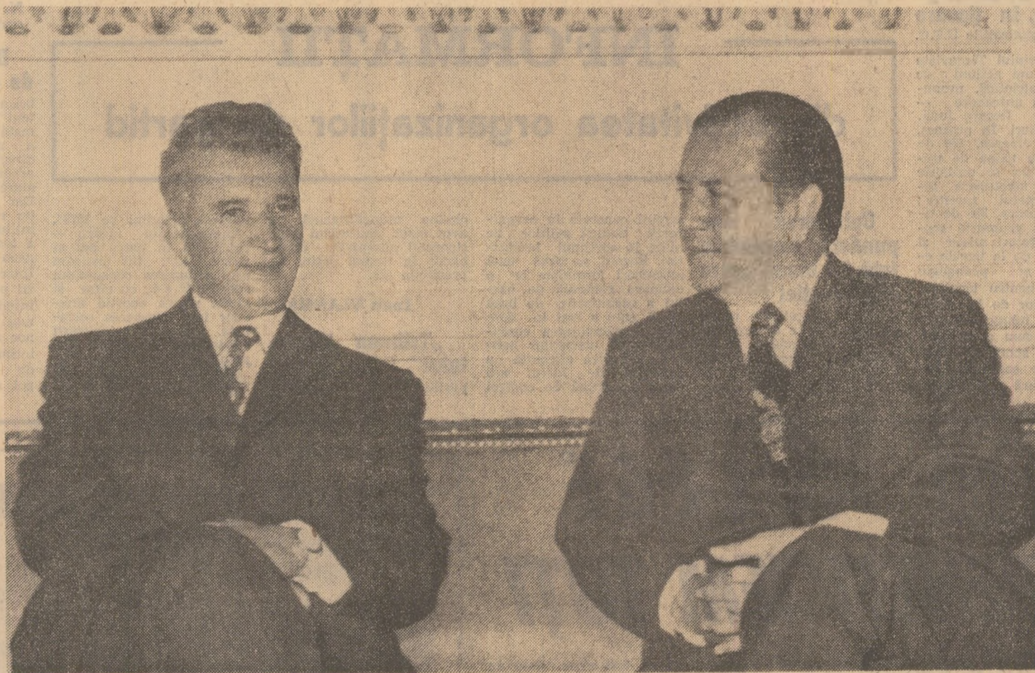
În timpul convorbirilor dintre cei doi președinți

Într-o ambianță de stimă și respect reciproc, în spiritul dorinței de adîncire a prieteniei și colaborării dintre popoarele română și venezuelean, continuă