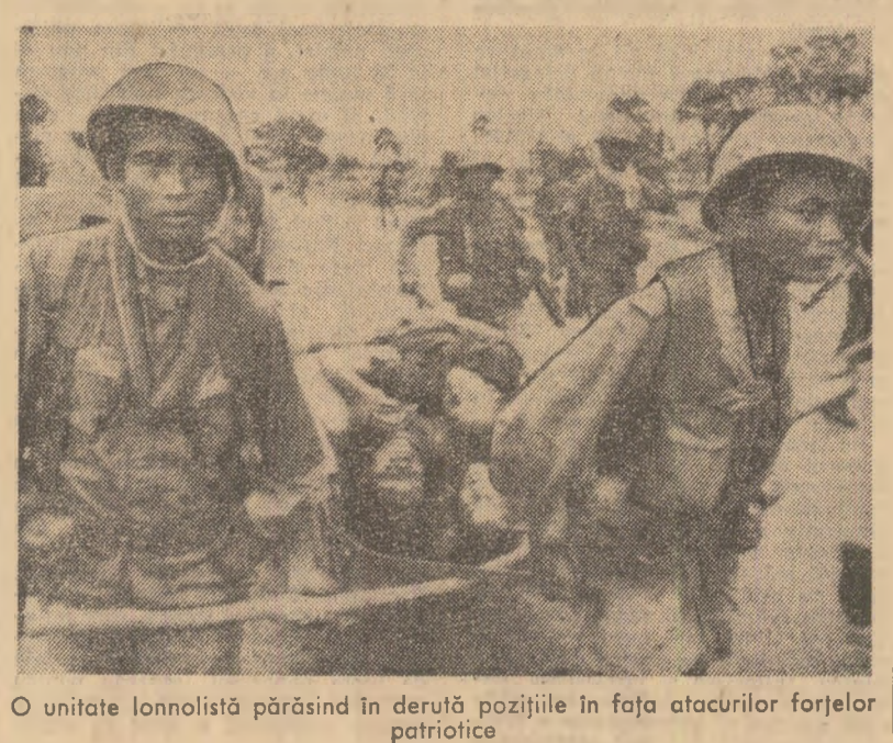
O unitate lonolistă părăsind în derută pozițiile în fața atacurilor forțelor patriotice.

Texte suplimentare privind lucrările conferinței.