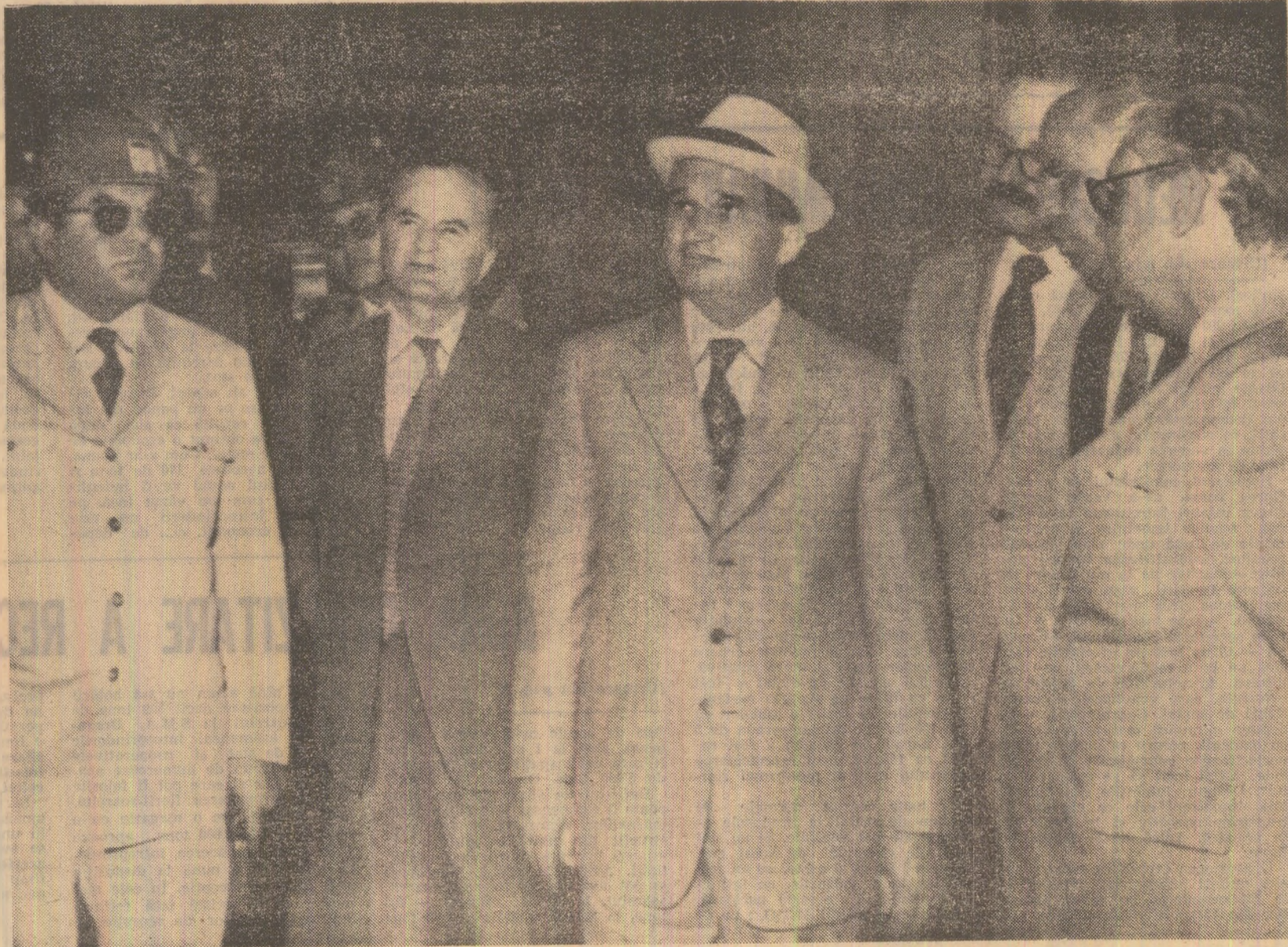
La Uzinele siderurgice ale Orinocului („Sidor”).