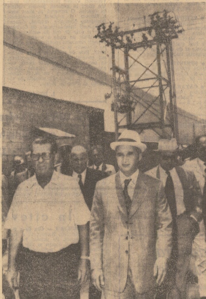
În secțiile întreprinderilor „Aluminio del Caroni S.A.” („Alcasa”)

Culoarea stacoajie a pămîntului, ce se dezvăluie ochilor, de o parte și de alta a autostrăzii care duce spre primul obiectiv introdus în programul vizitei, portul fluvial al „Siderurgica del Orinoco” („Sidor”), ne reamintește că ne aflăm într-o zonă bogată în minereuri. Produsele finite obținute din aceste minereuri, ca și materiile prime necesare procesului de producție ies și intră prin poarta fluviului, la ale cărei dane pot accesa nave pînă la 15.000 de tone/dw. Specialiștii și tehnicienii venezueleni dau explicații amănunțite despre activitatea