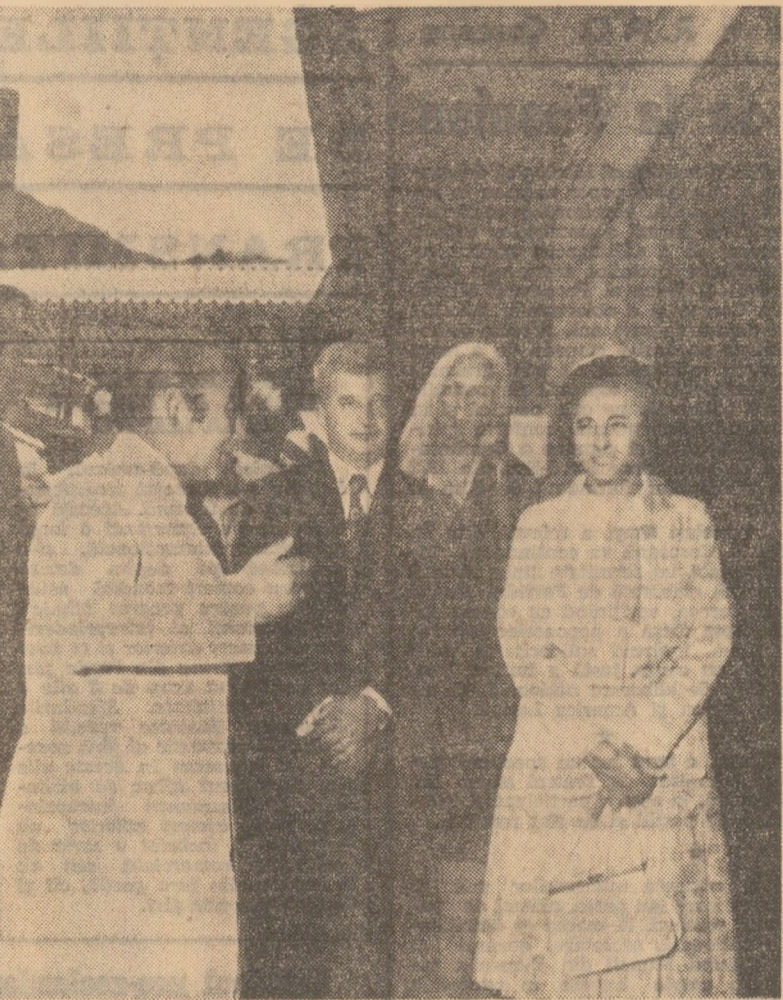
Imagini din timpul vizitei în întreprinderi industriale. La fabrica de ciocolată și produse zaharoase „Savoy” din Caracas (fotografia din stânga) și la portul fluvial al uzinelor siderurgice „Sidor” (fotografia din dreapta)