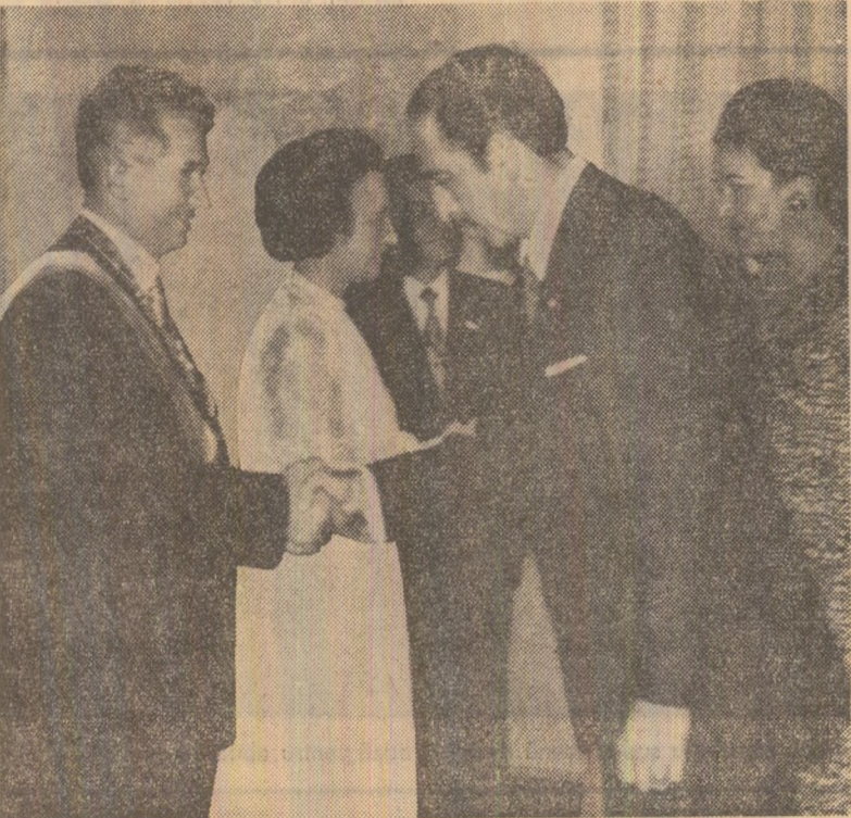
La ceremonia prezentării șefilor misiunilor diplomatice acreditați la Caracas

la invitația ministrului minelor, și am fost primiți cu cea mai mare amabilitate, vizita dovedindu-se deosebit de interesantă pentru noi în ce privește cunoașterea diferitelor aspecte legate de dezvoltarea economică a țării dumneavoastră. Singurul lucru pe care mi-l dorim este ca să plecăm de la noi cu amintiri într-un fel asemănătoare celor cu care ne-am întors noi din țara dumneavoastră. Cînd v-am dus să vedeți fluviul Orinoco ne-am gîndit la Dunăre. Întreprinderea noastră siderurgică ne amintește de Combinatul de la Galați.