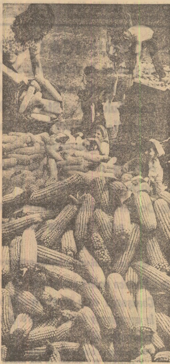
La cooperativa agricolă din Furculești, județul Teleorman, porumbul este cules și depozitat cu grijă.