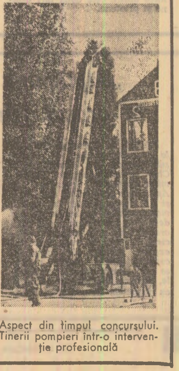
Aspect din timpul concursului. Tinerii pompieri intr-o intervenție profesională