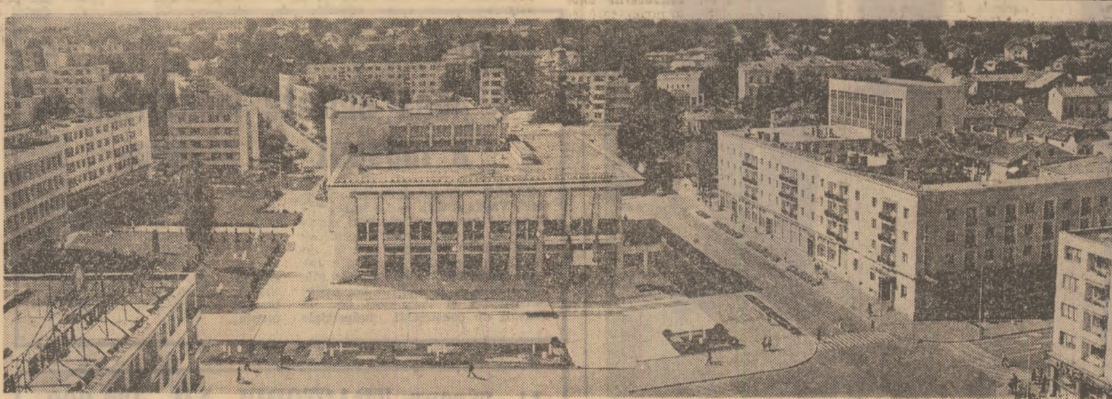
Suceava. Imagine din centrul orașului