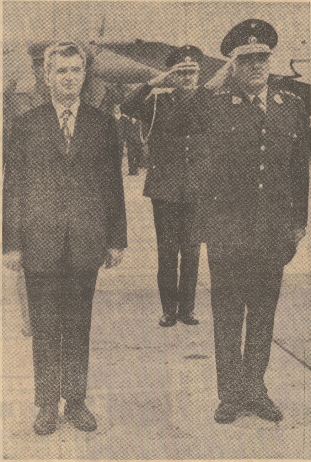
Aspect de la ceremonia primirii pe aeroportul din Lima

La sosire, o gardă militară prezidențială a prezentat onorul. Președintele Nicolae Ceaușescu, tovarăsa Elena Ceaușescu și celelalte persoane oficiale au păstrat un moment de reculegere în fața monumentului. Oaspeții români au vizitat apoi Panteonul. Președintele Nicolae Ceaușescu și tovarăsa Elena Ceaușescu au semnat în Cartea de onoare: „Aducem omagiul nostru profund eroilor naționali ai Republicii Peru”.