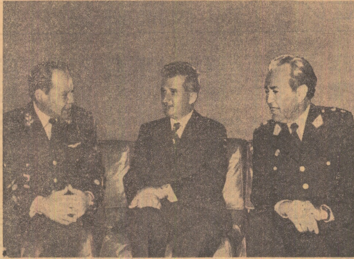
În timpul întâlnirii tovarășului Nicolae Ceaușescu cu ministrul muncii, Pedro Sala Orozco, și cu șeful sistemului național de mobilizare socială, Rodriguez Siqueroa

Această suită de întrevederi confirmă caracterul de lucru al vizitei, obiectivele ei ferme de explorare și de identificare a celor mai potrivite căi și mijloace pentru dezvoltarea în continuare a raporturilor de colaborare dintre Republica Socialistă România și Republica Peru, în interesul celor două țări, al cauzei păcii și progresului în lume.