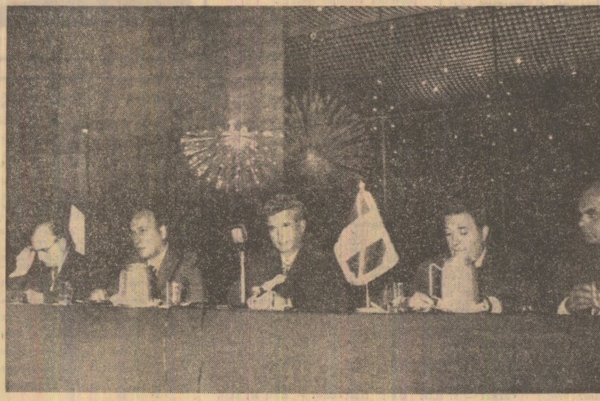
În timpul conferinţei de presă

TOVARĂŞUL NICOLAE CEAUŞESCU: Ca să vă răspund la această întrebare mi-ar trebui mult timp. Va invit în România ca să discutăm mai pe larg aceste probleme.