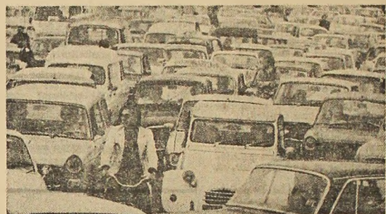
Automobilii — în fruntea clasamentului risipitorilor de energie

Pierderile produse în procesul transformării combustibililor primari în energie electrică, precum și cele din rețeaua de distribuție fac ca, la capătul circuitului, becul să utilizeze doar patru la sută din energia potențială provenită din cărbune, păcură, gaze etc. De aici — scrie revista franceză „L'EX-PRESS” — a apărut, atît în Fran-