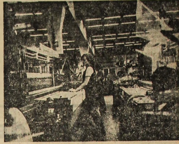
Într-una din secțiile Fabricii pentru stoffe de mobilă și jesături tehnice din Gheorghieni

Pornind de la sarcinile stabilite prin hotărârea Comitetului Executiv al C.C. al P.C.R. și de la prevederile Decretului Consiliului de Stat referitoare la gospodărirea rațională a energiei electrice și combustibilului, ancheta noastră întreprinsă în mai multe unități din cadrul Ministerului Economiei Forestiere și Materialelor de Construcții urmărește să releve modul concret în care se acționează în scopul reducerii operative în viață a programelor elaborate pentru reducerea consumurilor la cîteva produse — și anume: CIMENT, PLĂCI FIBROLEMNOASE ȘI CELULOZĂ.