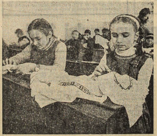
De pe băncile școlii te obișnuiești cu munca (la Școala generală nr. 1 Negrești - Oas)