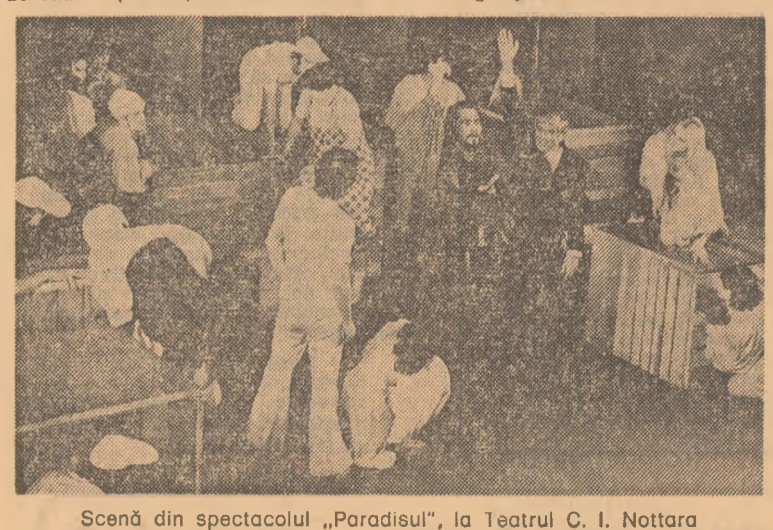
Scenă din spectacolul „Paradisul”, la Teatrul C. I. Nottara