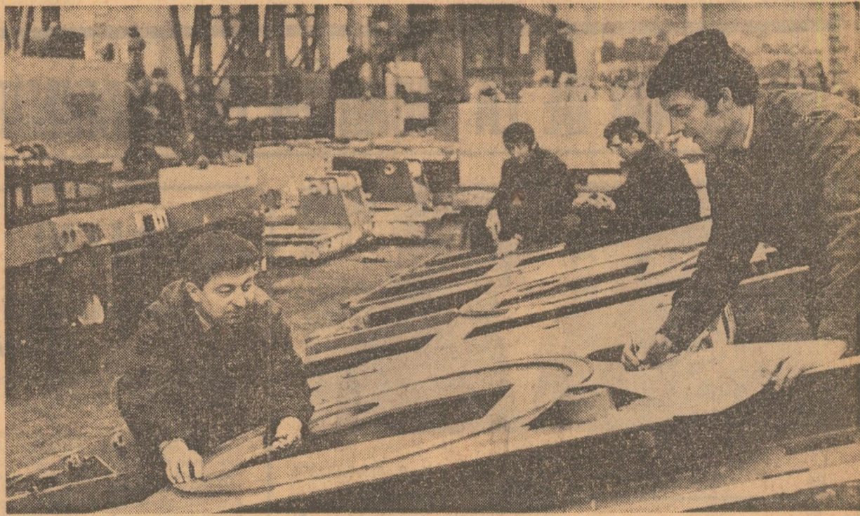
În sala de montaj a întreprinderii „Progresul” din Băila.