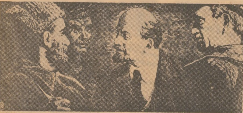
Lenin în 1917 de V. P. SELEZNEV