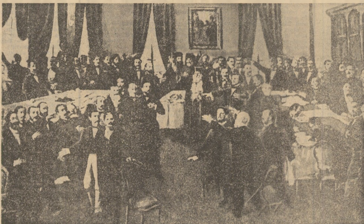
TH. AMAN: Proclamarea Unirii