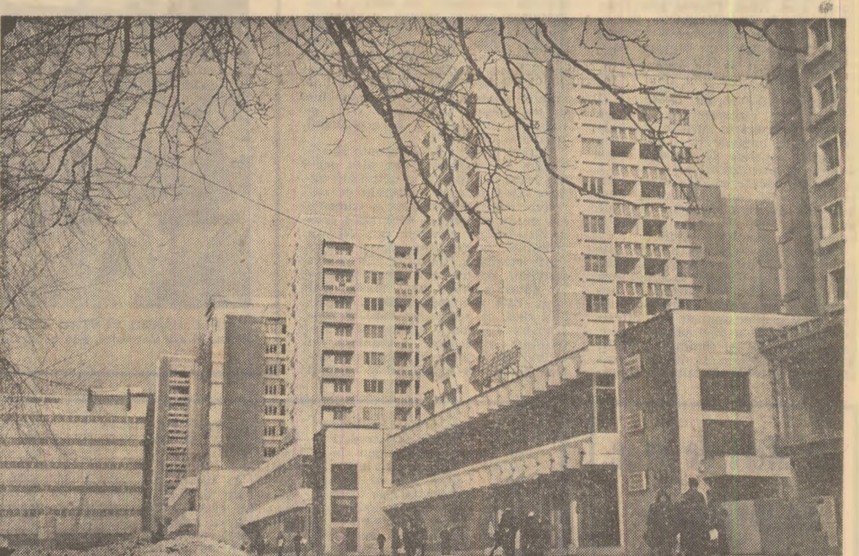
Construcții noi în orașul Pitești

În vederea antrenării tuturor cetățenilor la înfăptuirea planurilor de dezvoltare armonioasă a localităților, consiliile comunale ale Frontului Unității Socialiste din județul Arad, cu sprijinul deputaților și comitetelor de cetățeni, inițiază numeroase acțiuni de muncă patriotică pentru buna gospodărire și înfrumusețare a comunelor, precum și pentru realizarea unor însemnate obiective edilitare de