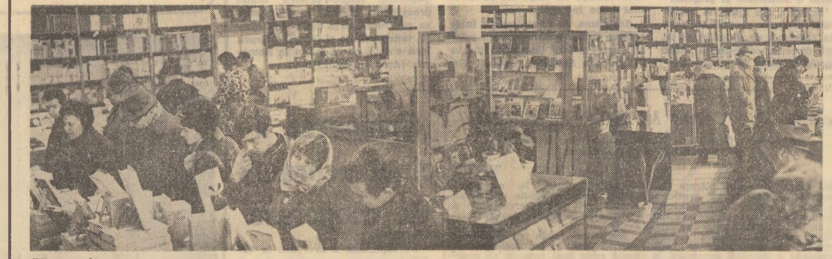
ZILELE CĂRȚII PENTRU TINERET — o manifestare de prestigiu găzduită în această săptămîna de librăriele bucoarene, de școli, întreprinderi și instituții ale Capitalei. Din programul zilei de azi reținem simpozionul cu tema „Tineretul și cartea” ce va avea loc la ora 16 la Ateneul tineretului.