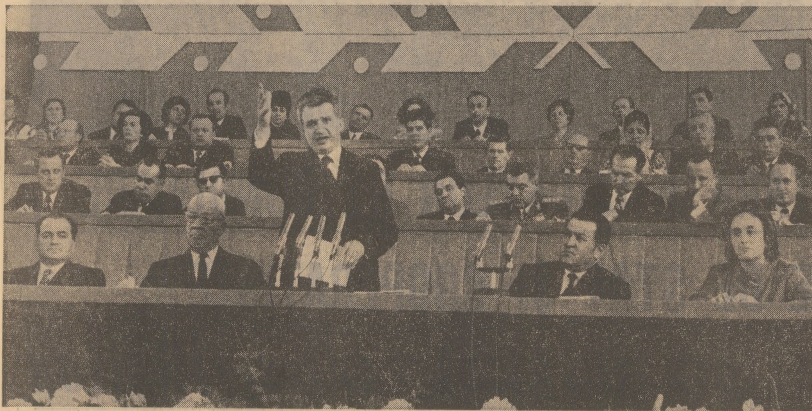
Tovarășul Nicolae Ceaușescu rostește cuvîntul de închidere a lucrărilor