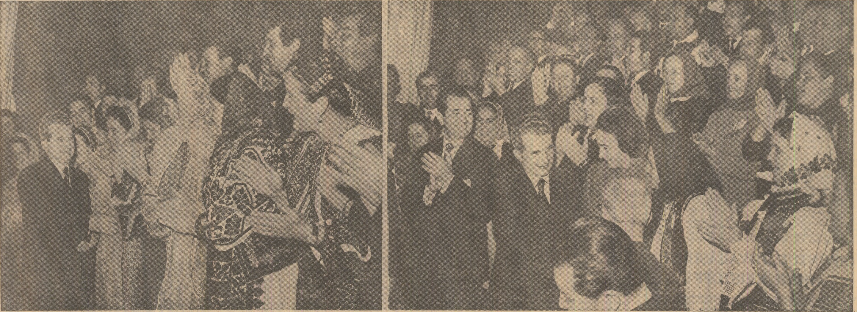
Expresie via a dragostei și stimei pe care întregul nostru popor o poartă tovarășului Nicolae Ceaulescu

Vă urez tuturor, întregului nostru popor, multă sănătate, furtorie, o viață îmbelsugată! (Urale îndelungate, ovații, aplauze; se scandează „Ceaulescu—P.C.R.”). Cel prezenți ovaționează îndelung pentru partid, pentru Comitetul Central, pentru secretarii general ai partidului, tovarășul Nicolae Ceaulescu).