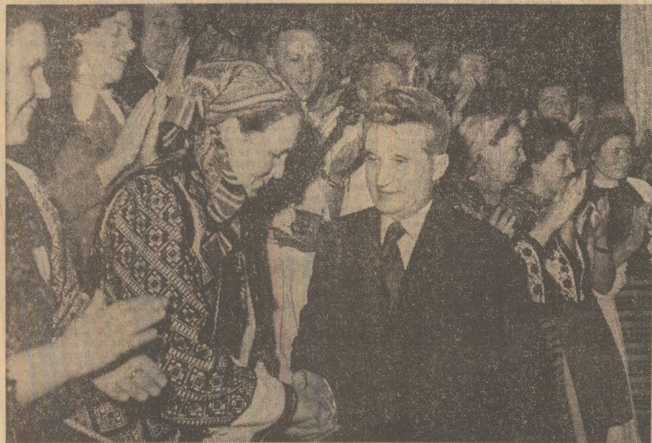
Tovarășii Nicolae Ceaușescu și tovarășa Elena Ceaușescu în mijlocul participanților la conferință