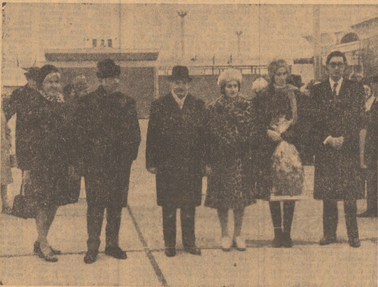
Înainte de plecare, pe aeroport