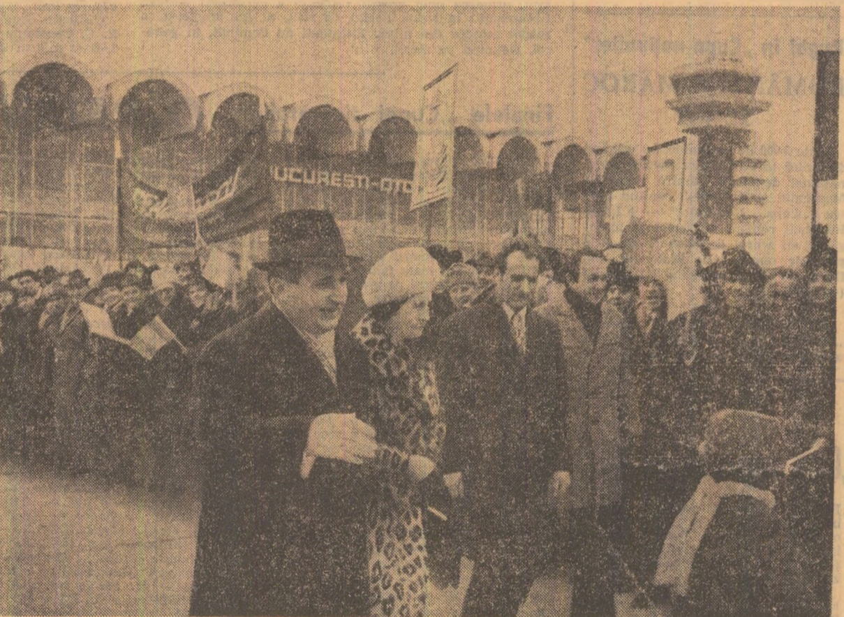
Mii de bucușteni au condus ieri, la aeroportul Otopeni, pe conducătorul partidului și statului nostru