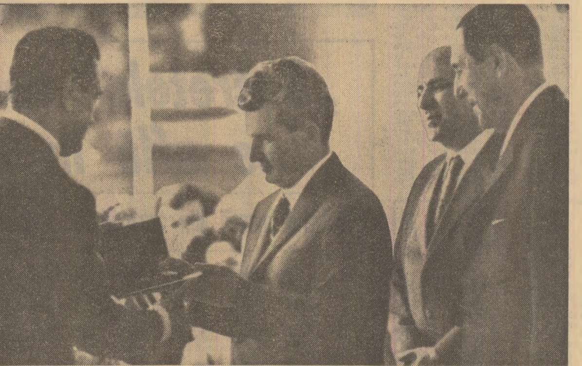
Un simbolic gest de prietenie: înmînarea „cheii de aur” a oraşului Buenos Aires

NICOLAE CEAUŞESCU Preşedintele Consiliului de Stat al Republicii Socialiste România