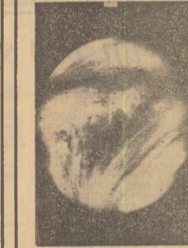
Fotografie a planetei Venus transmisă recent de sonda spațială americană „Mariner-10”

Chirurgul arab Moinal Chak transplantază, la operații oculare, cornee de la peștele de om. Mesic, care lucrează într-un spital din emiratul Dubai, a reușit pe această cale să redea vederea unui număr de pacienți. Donator al corneei este un pește care trăiește în apele Golfului Persic. La prima sa operație, efectuată în 1971, dr. Chak a folosit pești prinși de pescari în apele Golfului Persic. În prezent, el are un acvariu în care crește această specie în vederea unor transplanturi ulterioare.