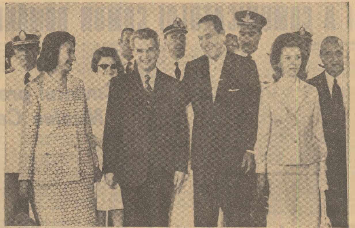
La sosirea, pe aeroportul din Buenos Aires

LA BUENOS AIRES, MANIFESTĂRI DE CALDĂ SIMPATIE ȘI PRIETENIE-EXPRESIE A BUNELOR RELAȚII ROMÂNNO-ARGENTINENE