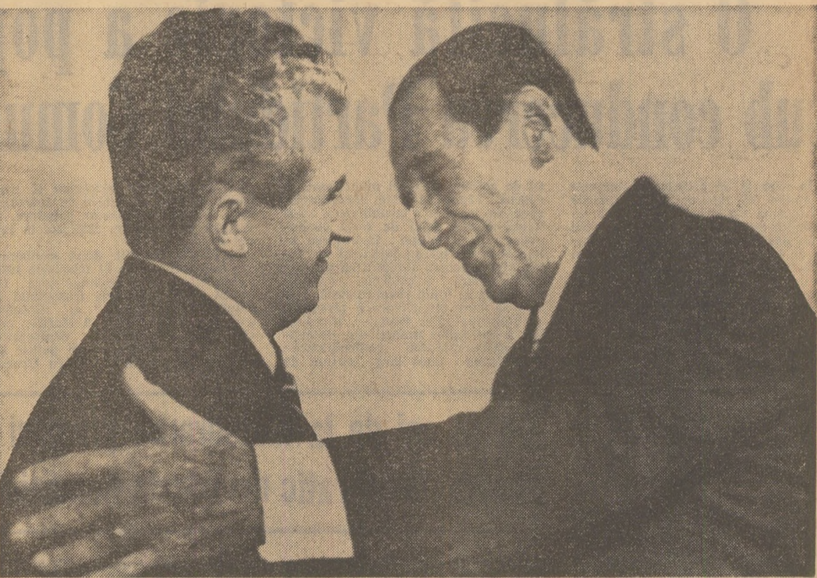
O călduroasă revedere