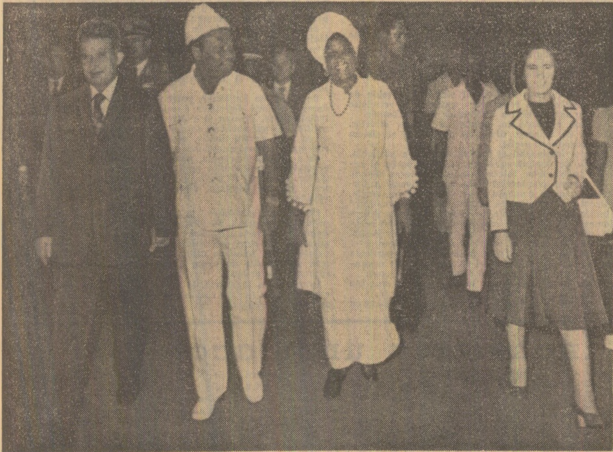
La plecarea din Monrovia