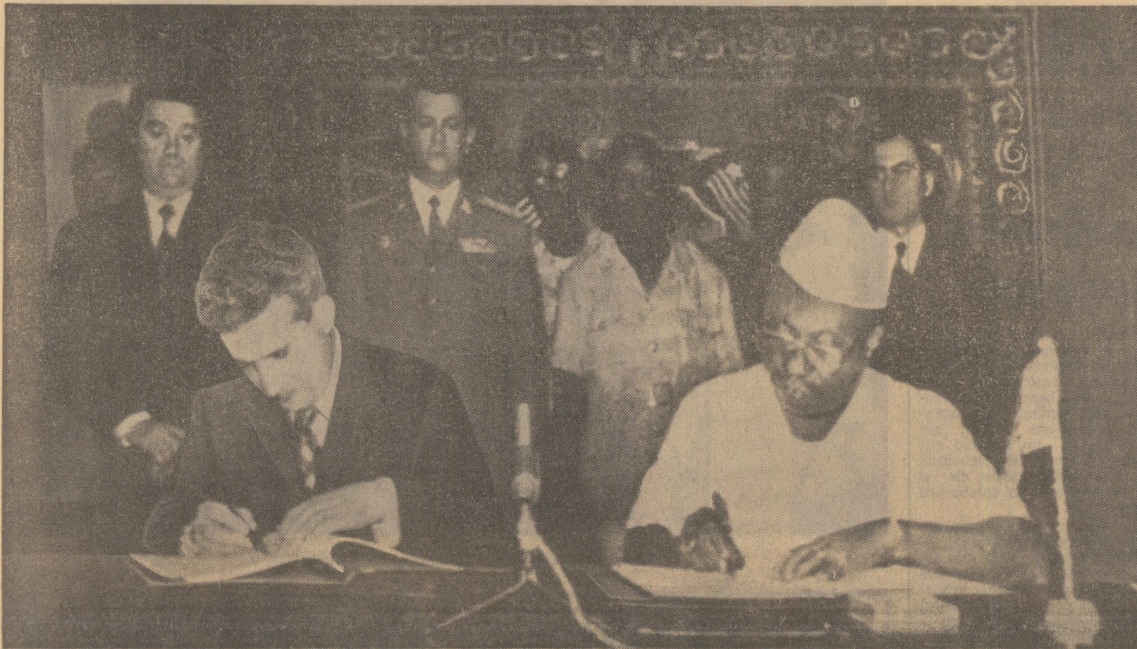
În timpul semnării documentelor oficiale