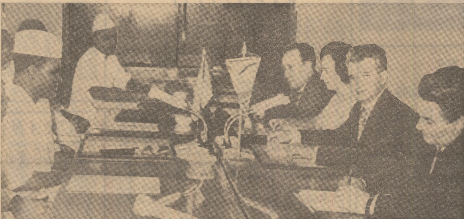
În timpul convorbirilor oficiale