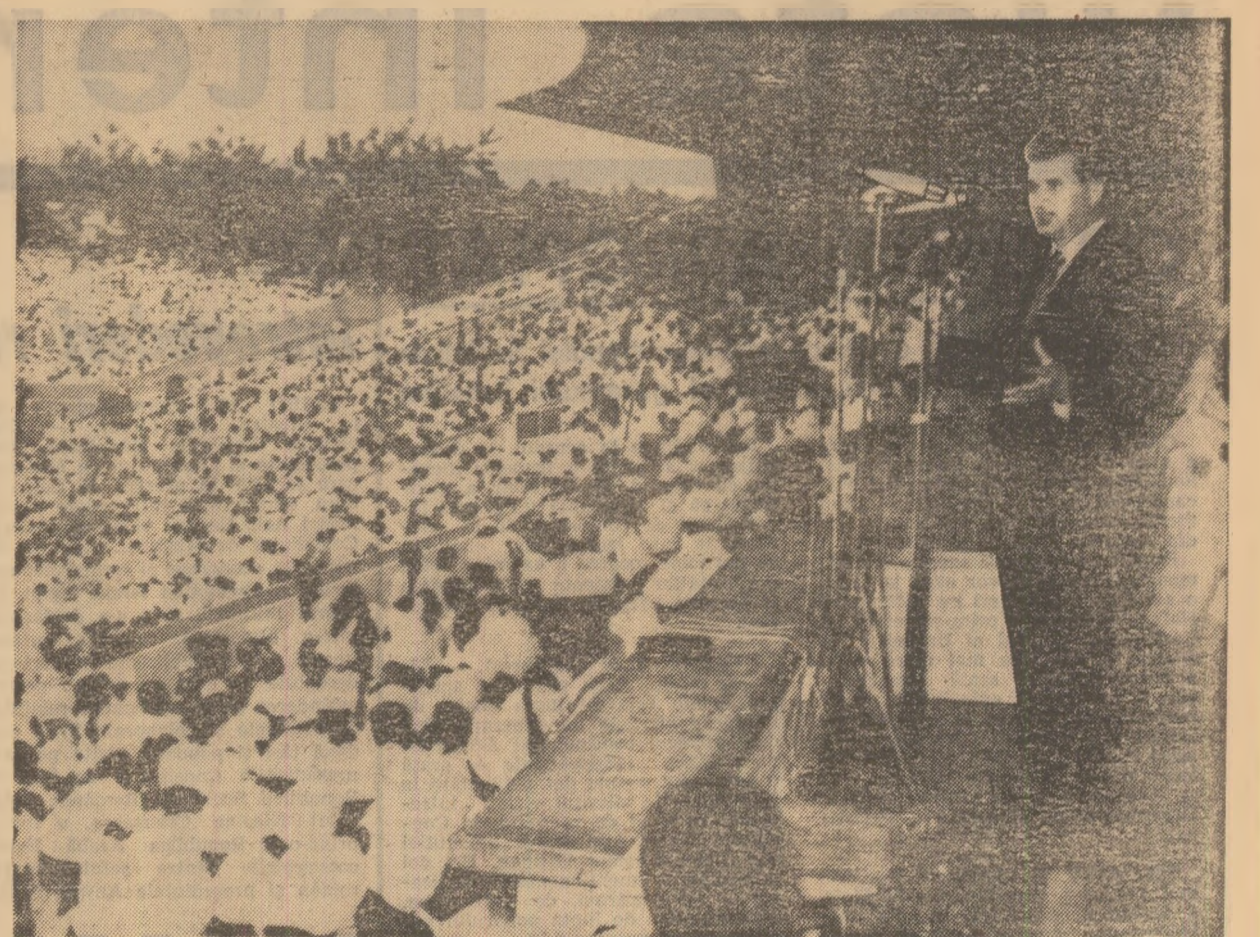
La marea adunare populară de pe stadionul din Conakry

Urez poporului frate guineez multă fericire, prosperitate, victorie în lupta sa pentru independenţă şi o viaţă liberă şi îmbelşugată. (Aplauze).