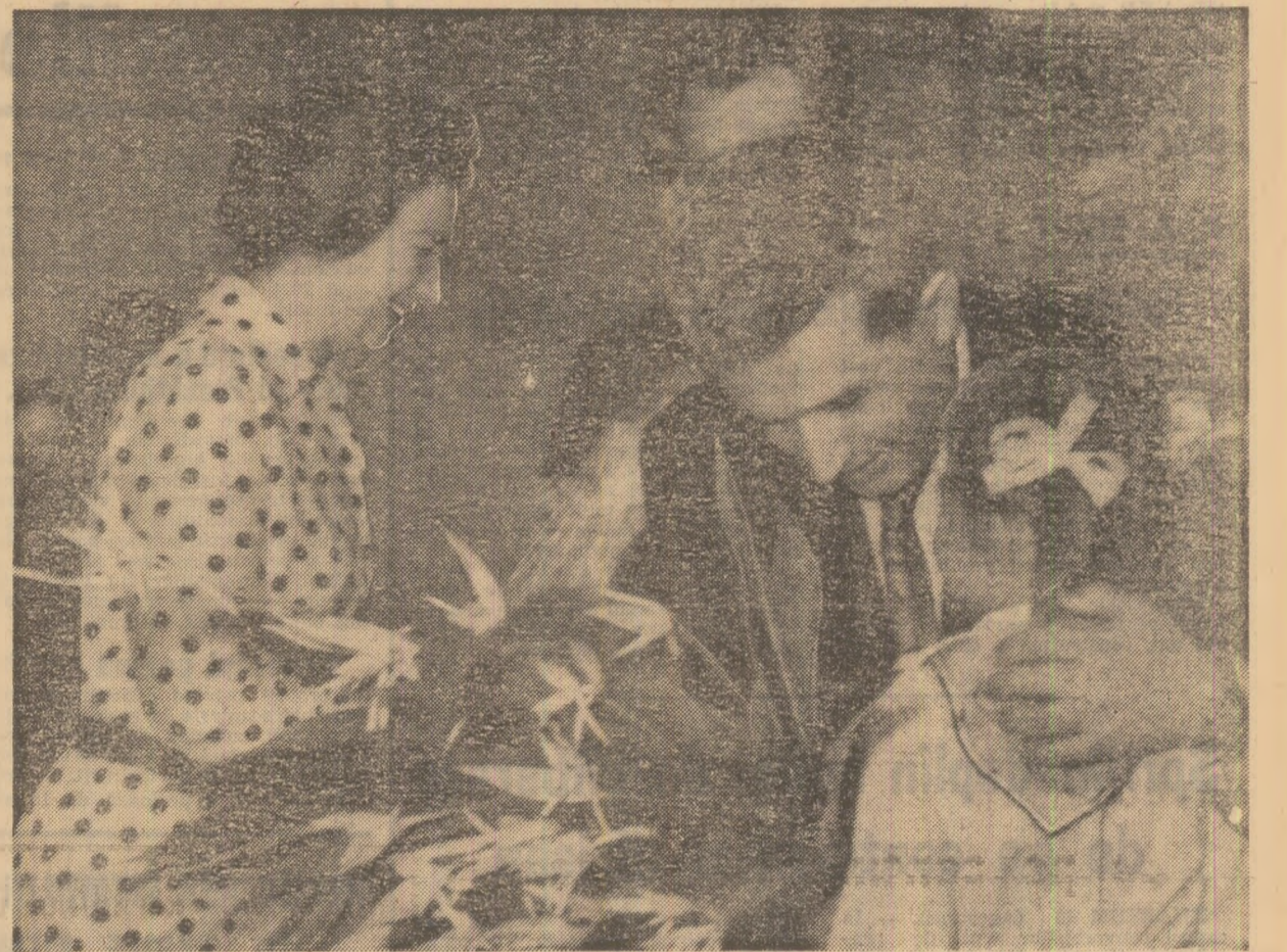
Flori oferite cu dragoste şi căldură