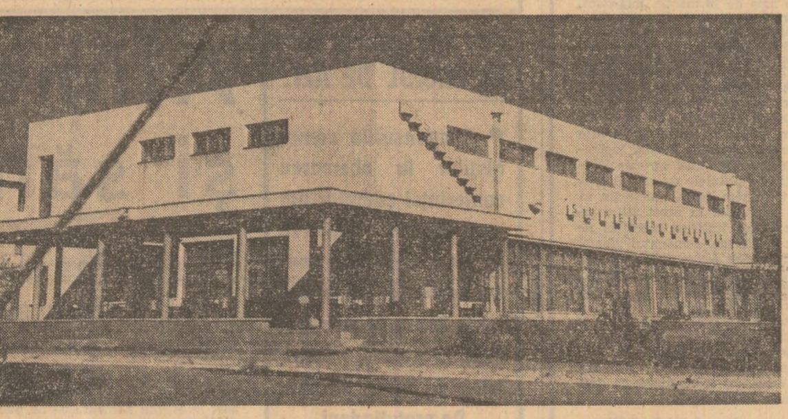
„Supermagazinul” din comuna Dărmănești, județul Bacău

Hîrtie pentru scris, hîrtie pentru tipărit, hîrtie înobilată și hîrtie acoperită la suprafață cu emulsii metalizate sau anticorozi-