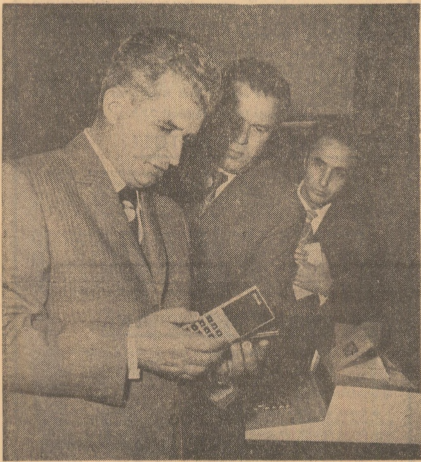
La întreprinderea de calculatoare se studiază cu atenție un nou produs

O vibrantă manifestare de atașament a clasei muncitoare, a maselor largi ale oamenilor muncii față de partid, față de conducătorul iubit