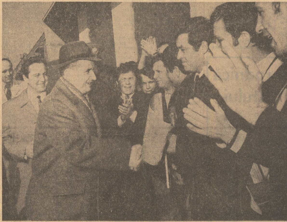
Prețutindeni calde strîngerii de mîină, aplauze entuziaste, muncitorii