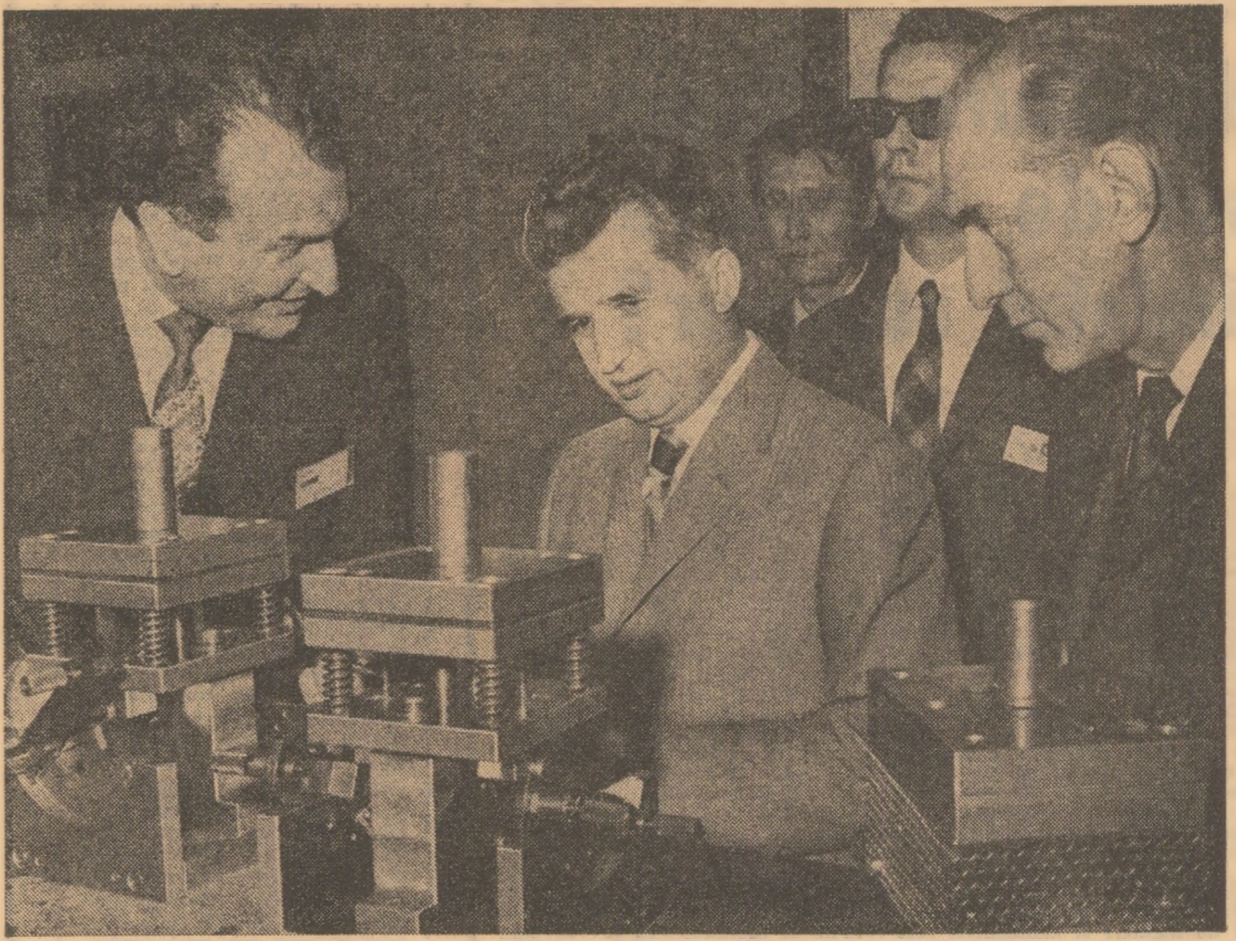
Modernizarea continuă a produselor s-a situat în centrul atenției la întreprinderea de aparate electronice de măsură și industriale