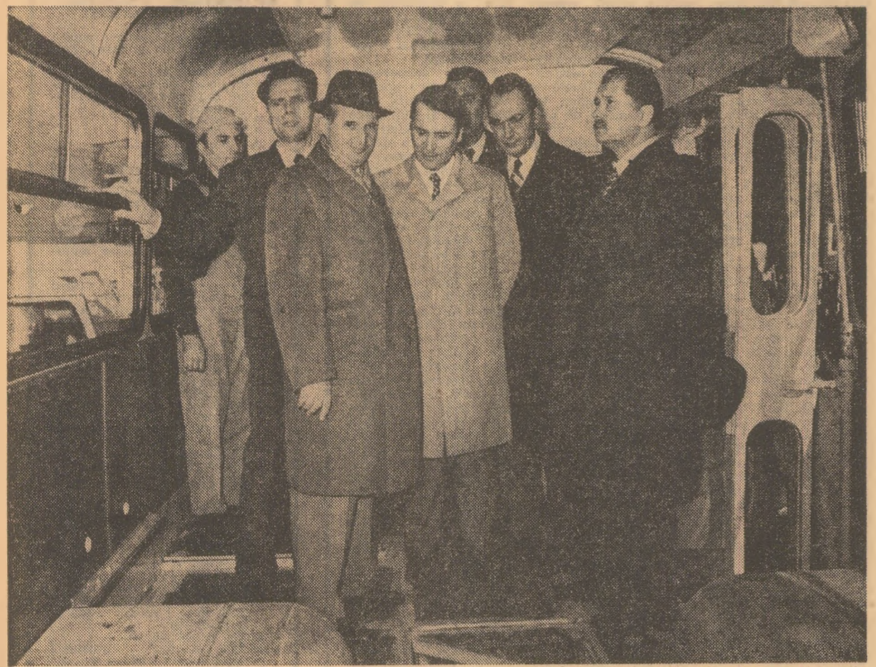
Tovarășul Nicolae Ceaușescu examinează un nou tip de autovehicul destinat transportului în comun