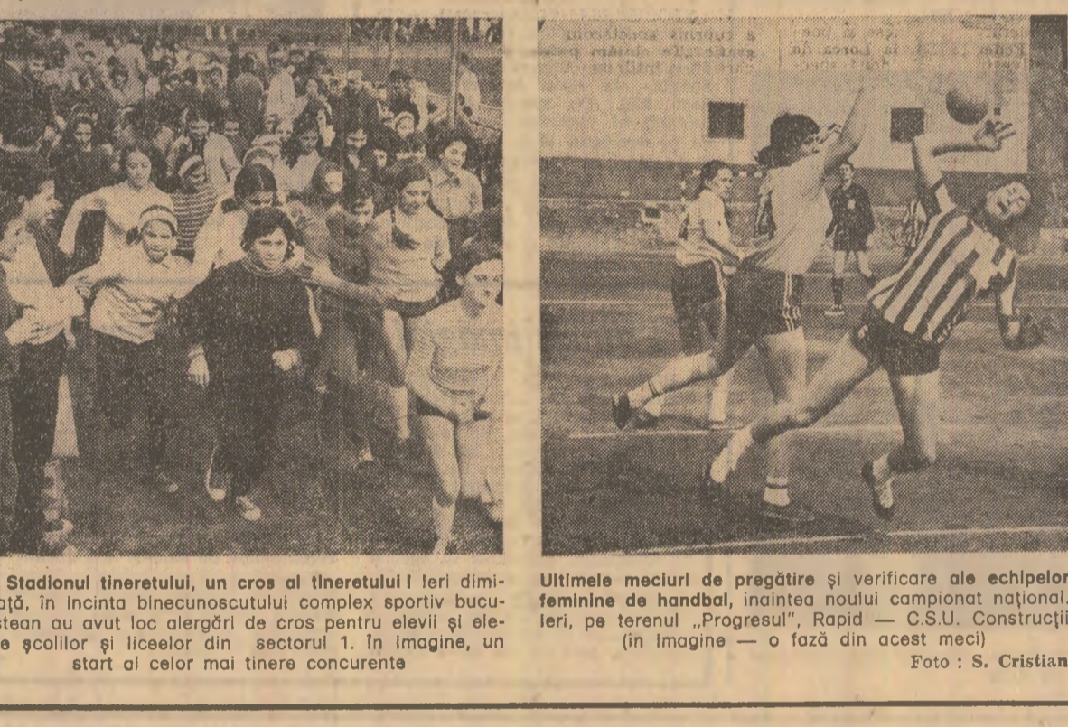
Pe Stadionul tineretului, un cros al tineretului I ieri dimineață, în incinta binecunoscutului complex sportiv bucureștean...