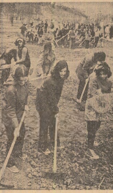
Ieri, la muncă patriotică în parcul tineretului din Capitală

Chiar din primele zile de la intrarea sa în funcțiune, noua linie s-a comportat excelent. În numai o decadă s-au realizat aici peste 250 tone țevi sudate de foarte bună calitate în baza acestor succese, colectivul noii linii tehnologice s-a angajat să atingă parametri proiectați pînă la 23 August, în loc de sfîșitul anului 1974, cum era stabilit inițial.