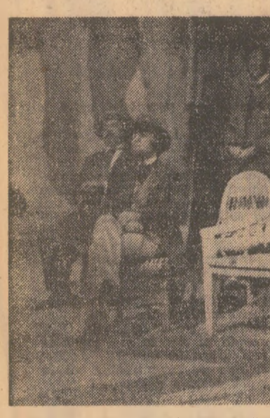
Scenă din spectacolul în premieră T.V. — „Pescorului”, de A. P. Cehov