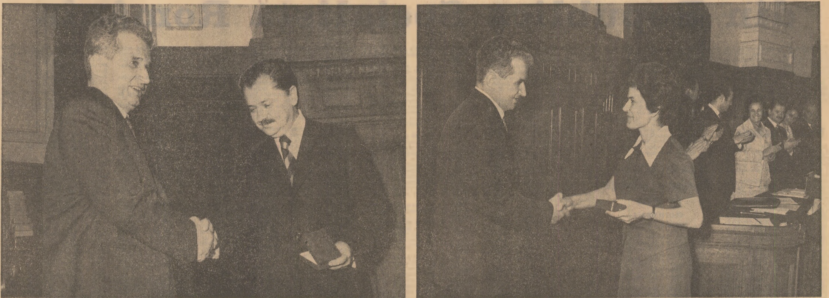
In timpul înmînării distincțiilor

Președintele Republicii Socialiste România decretază: