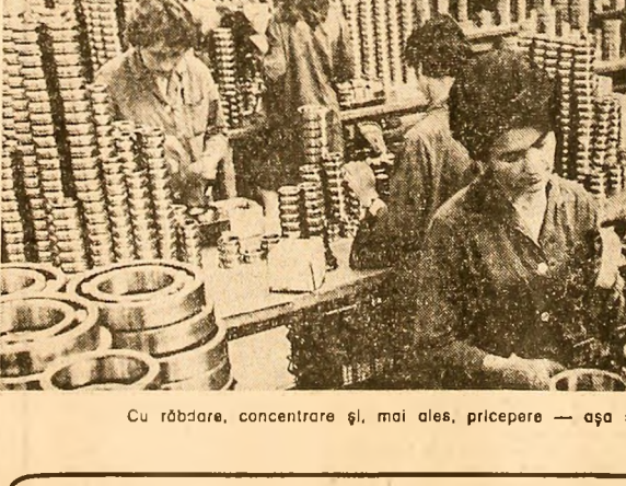
Cu răbdare, concentrare și, mai ales, pricepere — așa se nasc rîmelni la Brașov