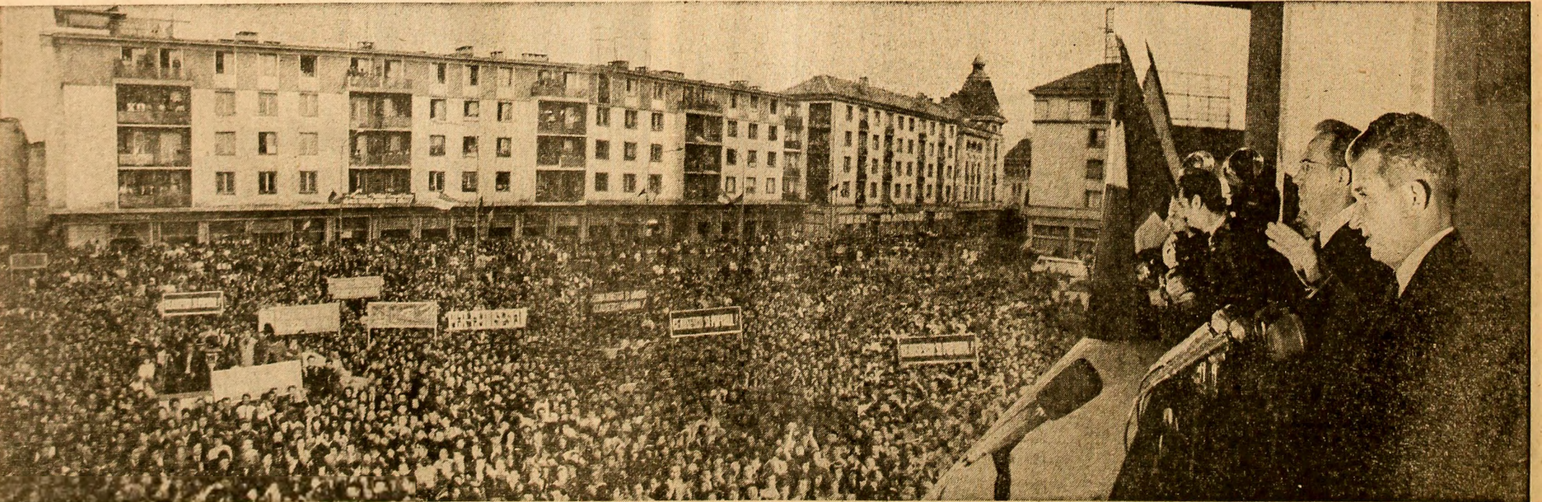
Marea adunare populară de la Craiova