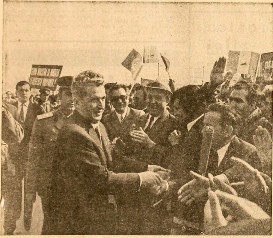
Locuitorii Craiovei salută cu deosebire căldură pe conducătorul iubit