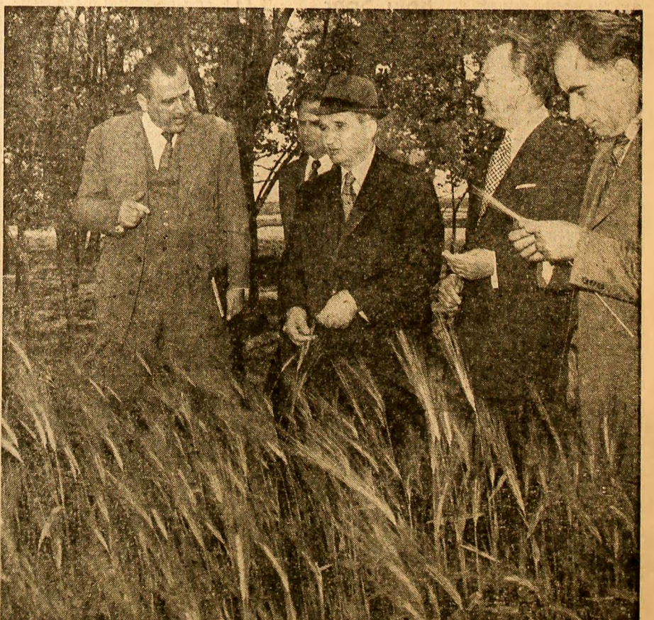
Discuții cu specialiștii pentru valorificarea cit mai bună a agriculturii Otteniei