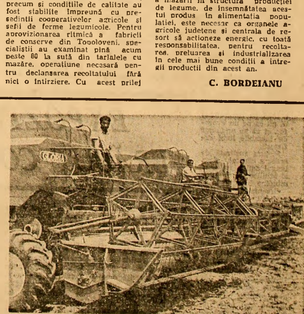
Secția S.M.A. de la cooperativa agricolă Ciocirioa, județul Ilfov, a fost dotată cu noi combine „Gloria”, care sînt gata pentru dealul lanurilor