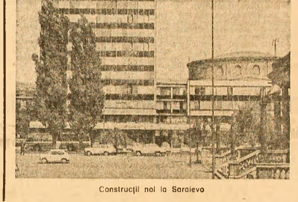
Ședința Comisiei permanente C.A.E.R. pentru transporturi