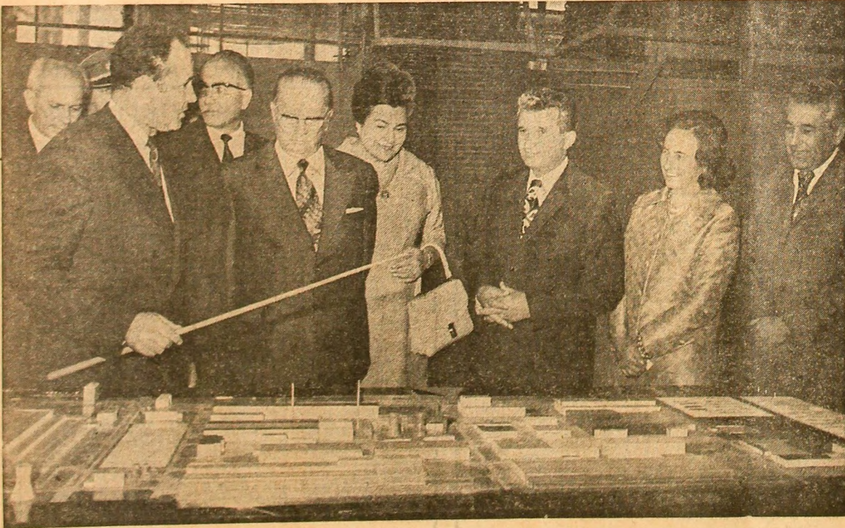
În timpul vizitei la întreprinderea de mașini grele din Capitală