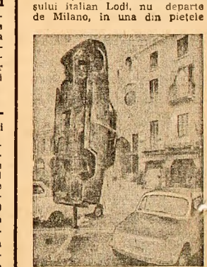
central ale urbel constituie un protest original împotriva cir- cuitaliei auto intense și a po- lării aerului cu gazele de eșap- ament. Protestarii au cerut municipalității adoptarea unor măsuri urgente pentru amelio- rarea situației.