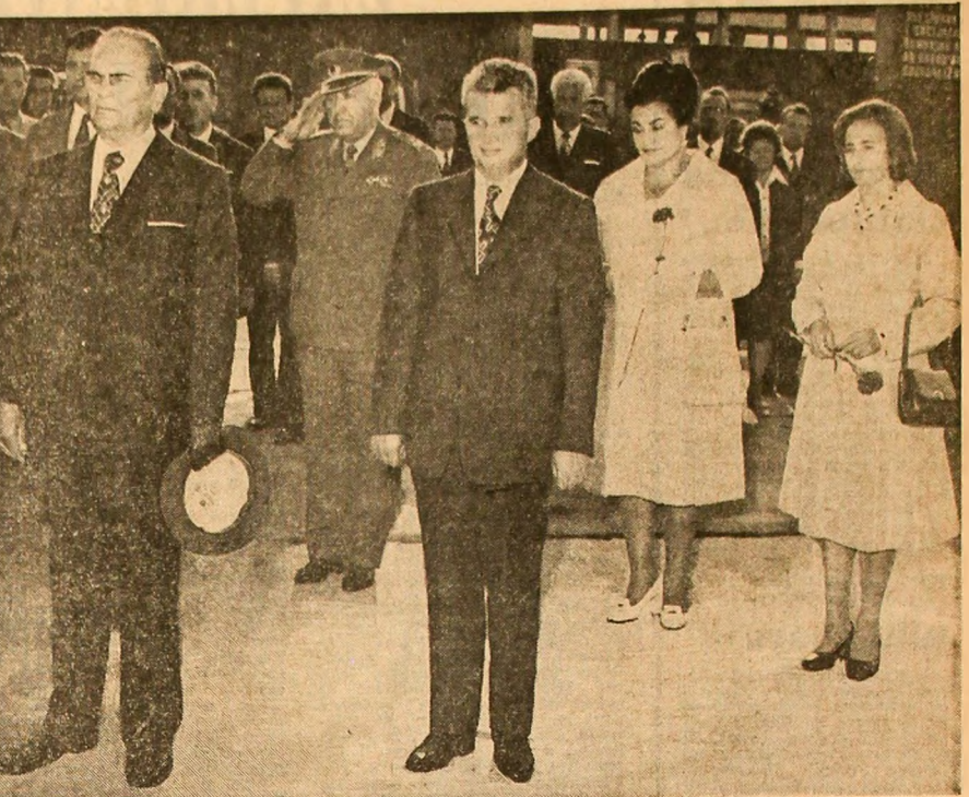
La plecare, pe aeroportul Otopeni

Invitația a fost acceptată cu mare plăcere. București, 11 iulie 1974