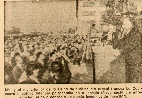
Miting al muncitorilor de la Uzina de turbine din orașul francez La Courneuve împotriva intenției patronatului de a închide cîteva ecclii ale întreprinderii și de a concede un număr însemnat de muncitori.

LISABONA 11 (Agerpres). — Președintele Portugaliei, Antonio de Sinnola, a demis întregul guvern, secretarii de stat și subsecretarii, a anunțat, joi seara, un purtător de cuvînt oficial, rețut de agențiile France Presse și United Press Inter- național. Duă cum se știe, primul ministru și patru membri ai cabinetului au demonstat marți seara. Comitetul Politic al Comitetului Central al Partidului Comunist a dat publicității o declarație în care se apreciază că formarea unui nou gu- vern impune o definire clară de po- ziții. Partidul Comunist continuă să considere că un cabinet de coaliție corespunde mai bine intereselor de- mocratizării vieții politice.