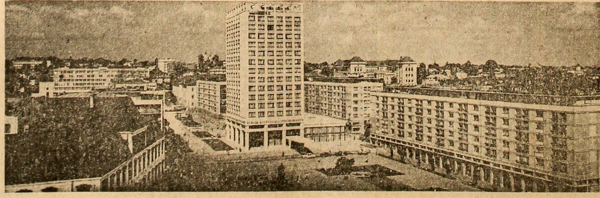
IAȘI — vedere din centrul orașului