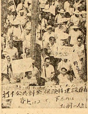
Japonia: Salariile din ramura construcțiilor, demonstrând în Tokio în sprijinul unor măsuri de contracțarea efectelor negative ale inflației asupra veniturilor oamenilor muncii

situația din Cipru, el a evidențiat sorjijul acordat de țara sa poporului cypriot și guvernului său legitim.