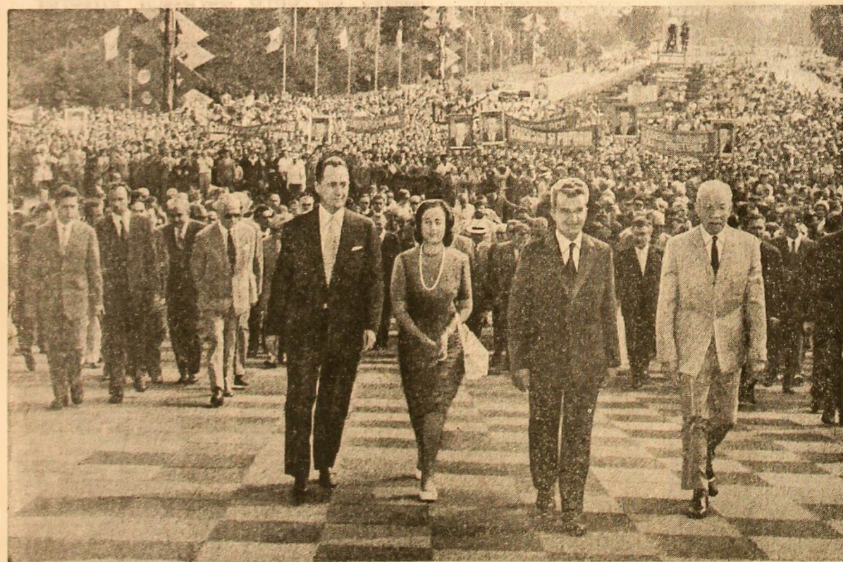
Mii de locuitori ai Capitalei aclamă cu căldură soseșea tovarășului Nicolae Ceaușescu, a celorlalți conducători de partid și de stat

Expoziția realizărilor economiei naționale ilustrează progresul considerabil al industriei, care obține astăzi o producție de 19 ori mai mare decît în anul 1950. Deosebit de semnificativ este avîntul pe care l-au cunoscut industria construcție de mașini și chimia. Construcția de mașini care realizează, numai în patru zile, întreaga producție a anului 1950,