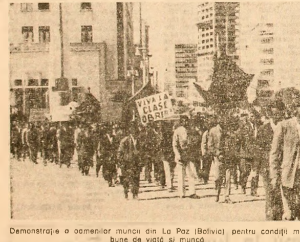
Demonstrație a oamenilor muncii din La Paz (Bolivia) pentru condiții mai bune de viață și muncă

Ultima din cele patru cupole ale clădirii Observatorului astronomic din Palermo a fost înălțată în afara marilor metropoli franceze. Pe cerul Parisului, apare luminat în timpul nopților de multă vreme becurile electrice și având o atmosferă poluată, vizibilitatea s-a redus foarte mult.