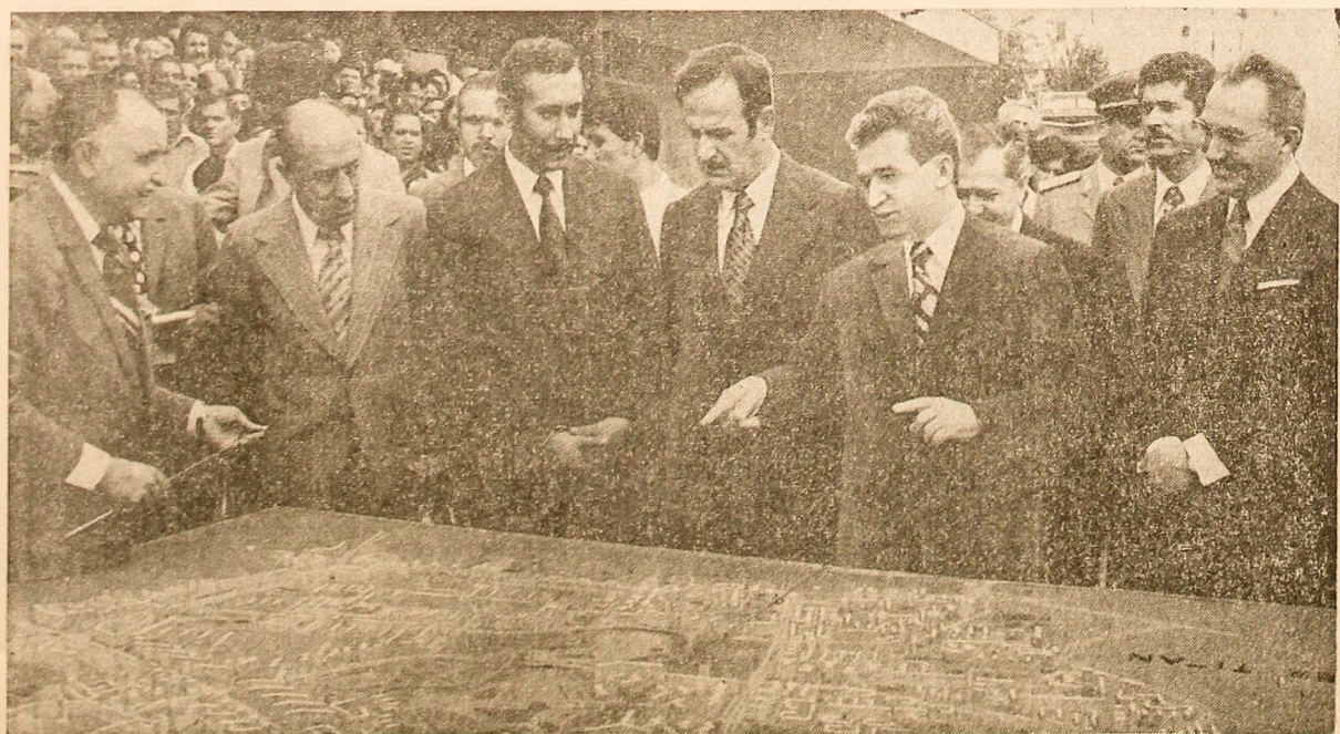
În fața machetei cartierului Titan