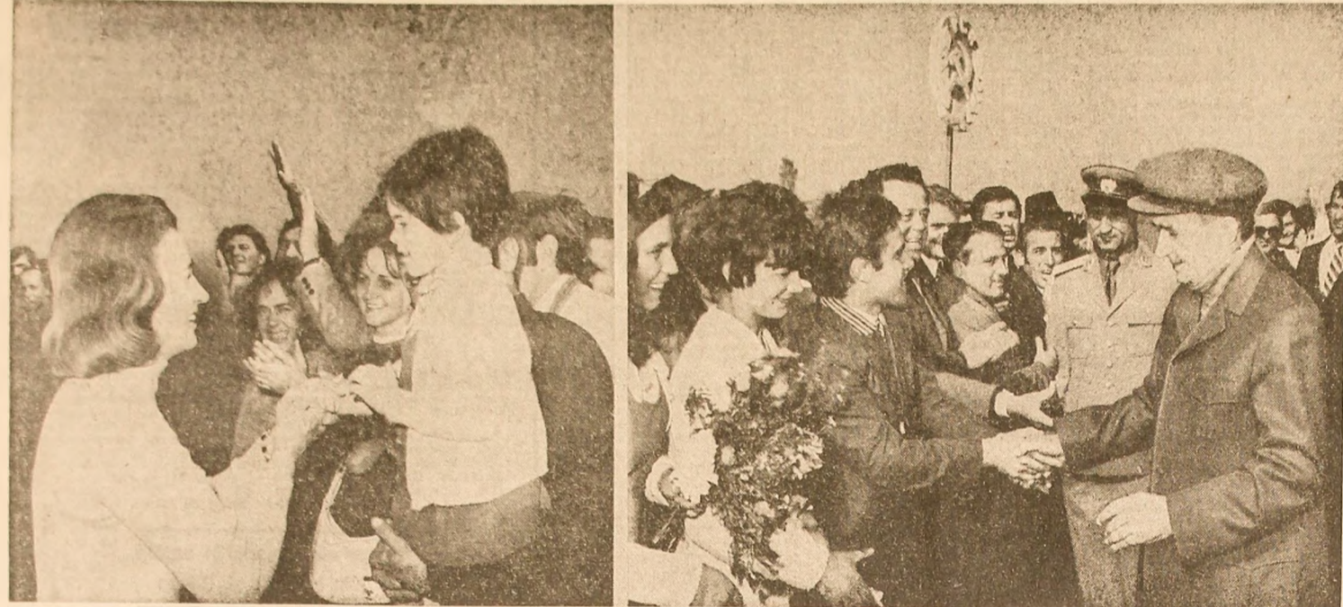
Aclamații entuziaste, călduroase manifestări de dragoste și stimă