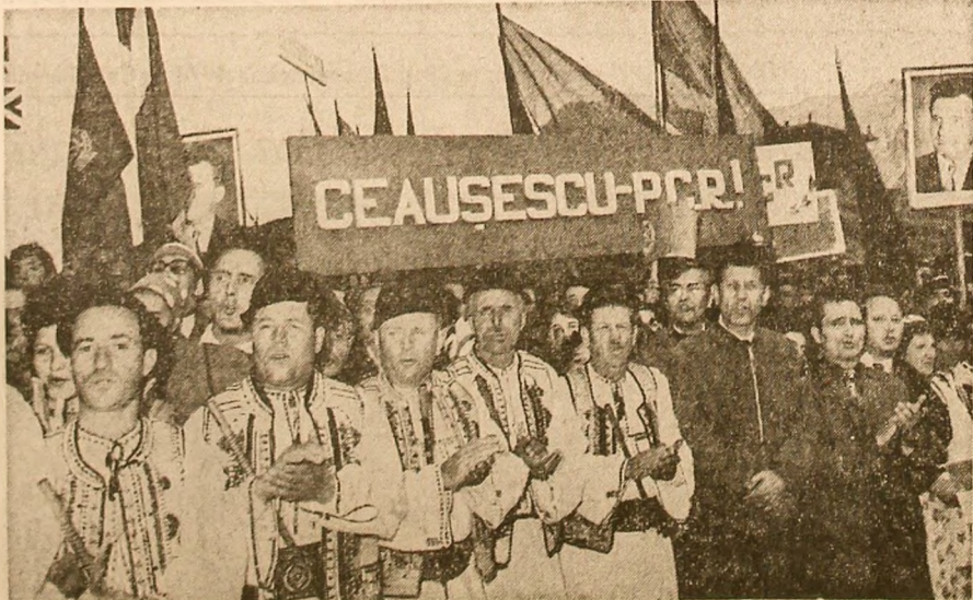
Cuvîntul secretarului general al partidului este subliniat cu puternice aplauze de participanții la marea adunare populară

Am lucrat pe multe șantieruri și nu cunosc profesie mai nîmă de satisfăcătoare tot entuziasmul și toată bărbăția, iar noi am învins. Și această victorie o închinăm partidului nostru iubit — Partidului Comunist Român. Am lucrat pe multe șantieruri și nu cunosc profesie mai nîmă de satisfăcătoare tot entuziasmul și toată bărbăția, iar noi am învins. Și această victorie o închinăm partidului nostru iubit — Partidului Comunist Român. Am lucrat pe multe șantieruri și nu cunosc profesie mai nîmă de satisfăcătoare tot entuziasmul și toată bărbăția, iar noi am învins. Și această victorie o închinăm partidului nostru iubit — Partidului Comunist Român.