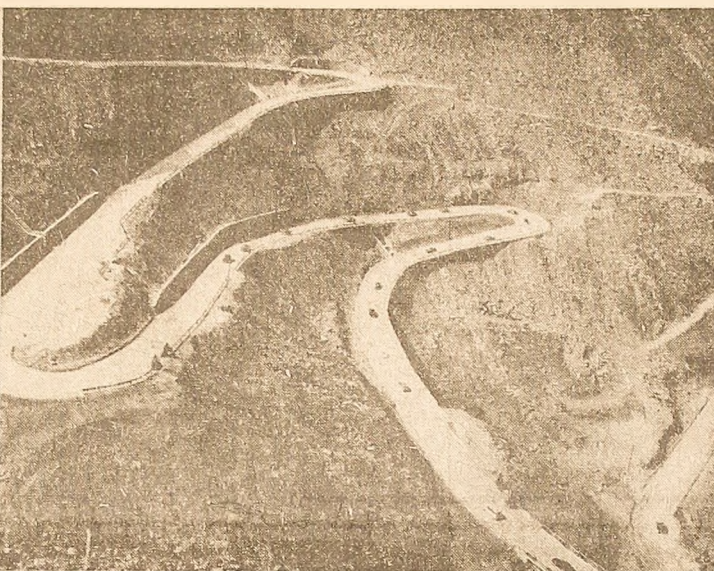
Noua magistrală a Făgărașilor