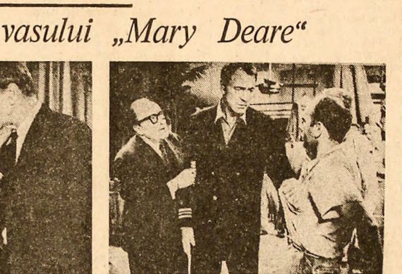
Cu: Gary Cooper și Charlton Heston. Regia: Michael Anderson