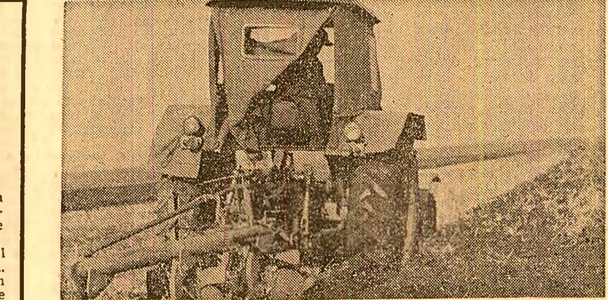
În județul Buzău au fost încheiate arăturile de toamnă. Se ară, în continuare, capetele de țara, terenurile care au fost ocupate cu vii bătrîne și părăgînite. Fotografiat de un meșteșugăruș de la cooperativa „Muncitorii din Zărnești, unde mecanizatorii de la S.M.A. Poșta Cîlnău trageau ultimele brazde

Trebuie abolită uniformizarea, care este aliatul principal al stagnării; sînt fiind că gîndirea care își însușește în mod temeinic metoda de investigație a materialismului dialectic și istoric se caracterizează prin originalitate, prin aflarea de noi și noi date în vederea soluționării, în sens revoluționar, a stărilor de