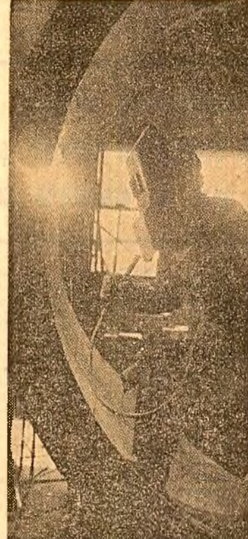
În secția cazaneriei a întreprinderii mecanice de utilaj chimic din București

Cooperativele agricole din județul Bacău au terminat arăturile adînci