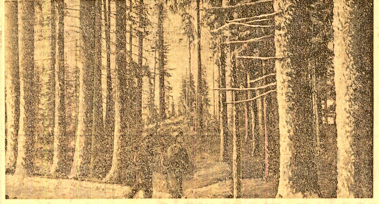
Investițiile pentru îmbunătățirea condițiilor de locuit vor cunoaște un ritm superior. În 1975 se vor construi în județul Arad peste 2.350 locuri de locuit...