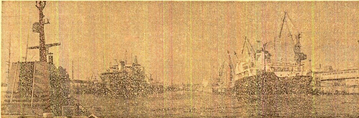
Zile de decembrie în portul Constanța

Țara noastră a avut zilele acestea oaspeți de seamă de pe pămîntul Africii luptătoare: delegația Frontului de Eliberare din Mozambic (FRELIMO) și a guvernului de tranziție din Mozambic, condusă de tovarășul Samora Machel, președintele FRELIMO. Poporul român a sălășuit cu multă bucurie și căldură această nouă vizită a solilor poporului mozambican eric, prima în condițiile nou create după victoria hotărîtoare obținută în lupta sa de eliberare națională și constituirea guvernului de tranziție de la Lourenço Marques. Se poate aprecia că înținerile și convorbirile pe care delegația mozambicană le-a avut cu delegația de partid și guvernamentală română, condusă de tovarășul Nicolae Ceaușescu, hotărîrile adoptate — sintetizate în Declarația solemnă comună și Comunicatul comun — prezintă o înaltă semnificație politică: ele exprimă profundă solidaritate militantă a României socialiste față de cauza poporului mozambican, față de idealurile luptei sale pentru neatenare, marchează o contribuție substanțială la punerea bazei dezvoltării relațiilor de cooperare multilaterale dintre cele două state, în perspectiva obținerii independenței depline a Mozambicului, act prevăzut a avea loc, așa cum se știe, la 25 iunie 1975.