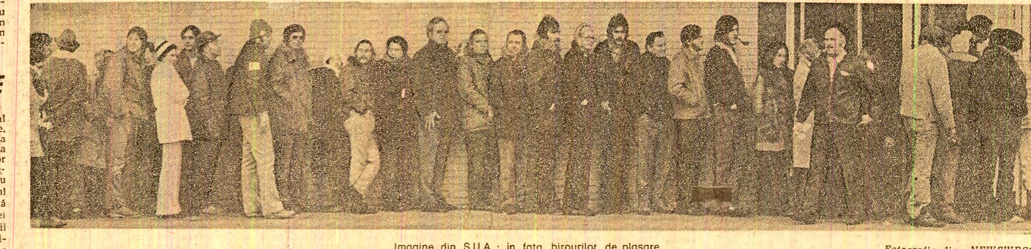
Imagine din S.U.A. : în fața birourilor de plasare.

Femeile belgiene sînt îngrijorate: totul arată că ele vor fi în mai mare măsură decît bărbații victime ale înrăutățirii situației economice. Șomajul lovește, în primul rînd, mina de lucru feminină. Un recensămînt din anul 1973 arată că numărul războiului existau mai mulți șomeri printre femeile decît printre bărbați. În timp ce în rîndul bărbaților șomajul a crescut cu 5 la sută într-un an, în rîndul femeilor a sosit cu 20,9 la sută.