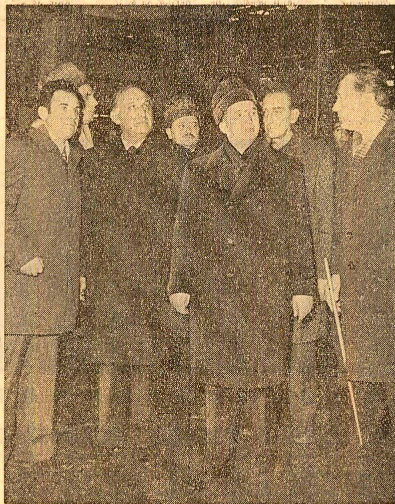
În timpul vizitei la întreprinderea de mașini-unelte și agregate