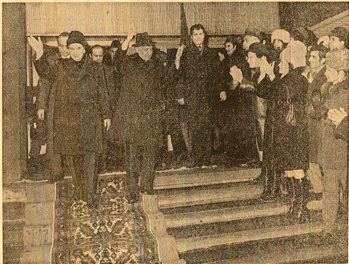
Se vizitează două dintre cele mai moderne unități comerciale bucureștene: magazinul „Cocor” și halele din Piața Unirii