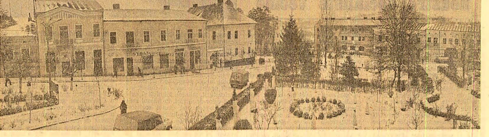
Zi de lărnă în pitorescul oraș Siret