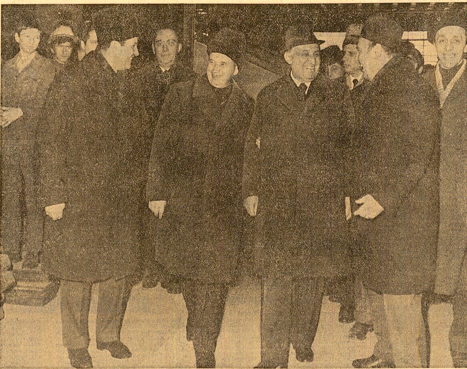
La întreprinderea de mașini grele

Sintetizând imaginea cu care pleacă de la marea întreprindere bucureștenă, tovarășul Todor Jivkov notează în cartea de onoare calde aprecieri la adresa harnicului colectiv de aici: „Exprim mulțumirile mele pentru posibilitatea care mi s-a oferit de a cunoaște întreprinderea de mașini grele din București. Cea mai puternică impresie pe care mi-a produs-o această vizită o reprezintă succesele României socialiste frățoșe în dezvoltarea industriei constructoare de mașini grele. Minunatul colectiv al uzinei îl urez noi realizări în activitatea sa productivă și tehnicoștiințifică, în adăncirea pe mai departe a colaborării și cooperării