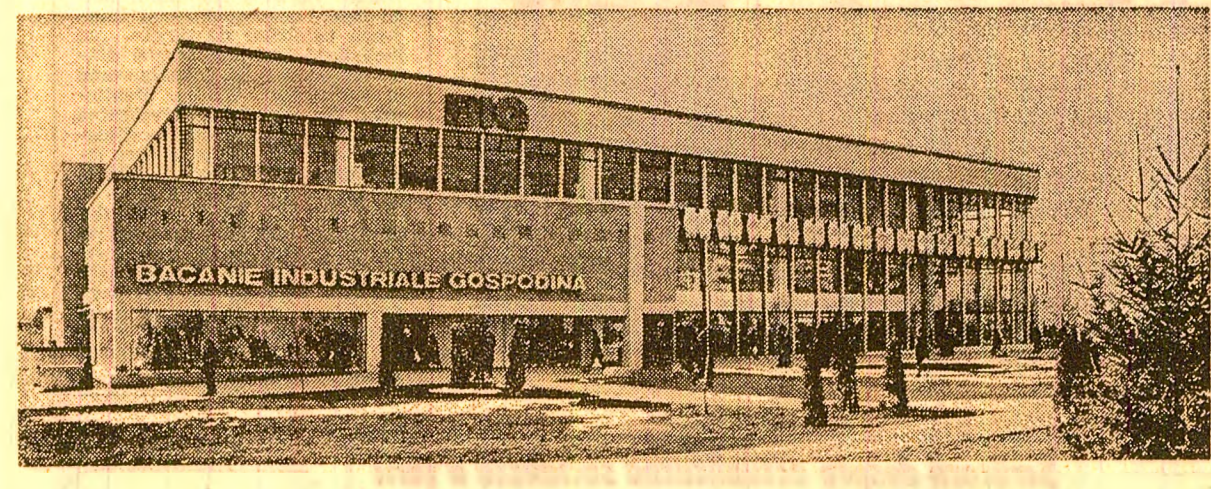
Așadar, acum cel mai mare B.I.G. din țară este cel din Bercești.

De ieri, în Capitală funcționează încă un magazin universal, care înscrie Piața Sudului, unde este amplasat, în rîndul marilor zone comerciale ale orașului. Unitate etalon a Ministerului Comerțului Interior, magazinul dispune de o suprafață de peste 8.500 metri pătrați, desfășoară o gamă sortimentală de mărfuri care numără peste 30.000 de articole. Situat în intrarea în cartierul Bercești, care are o populație cam cît cea a unui oraș obișnuit — peste 150.000 de locuitori — noul B.I.G., denumit astfel după grupul de mărfuri (băcănie, industriale și gospodărie) pe care le pune la dispoziția cumpărătorilor, asigură condiții optime de servire pentru 35.000 de persoane zilnic. La parter se desfășoară activitatea de vânzare de produse alimentare și de vânzare de diverse unități de alimentație publică (patiserie, cofetărie, bufet cu autoservire, o unitate „Gospodărie” și laborator, și etaj se găsește articole de textile, încălțăminte, tricotate, confecții, mercurie, artizanat și jucării, produse de folosință îndelungată. Alături de parter, și la etaj, se desfășoară activitatea de mărfuri sunt organizate pe bază de autoservire. Proiectat de Institutul de proiectări comerciale, magazinul dispune de instalații de condiționare a aerului, de agregate frigorifice de mare capacitate, precum și de spații corespunzătoare de depozitare a mărfurilor (D. Tîrcoab).