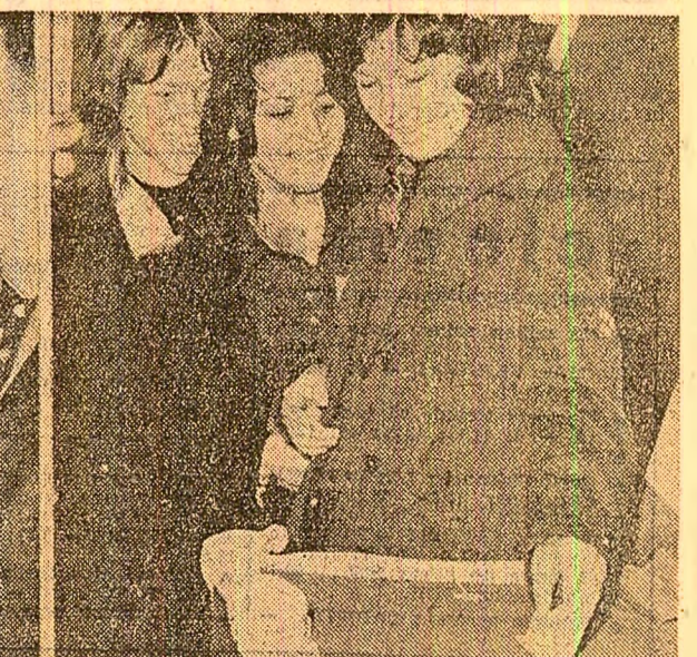
Un zîmbet larg, încredere și voie bună pentru primul vot. La urne, eleva ale liceului pedagogic