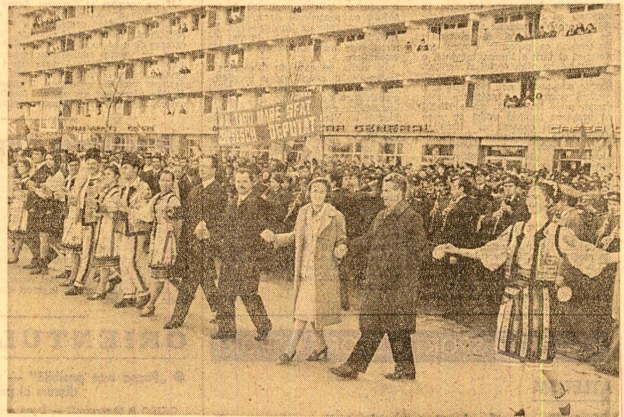
Moment sărbătorec în circumscripția electorală

Erau exprimate astfel gînduri și sentimente pe care oamenii acestei circumscripții, oamenii întregii țări le afirmaseră, aici și pretutindeni, prin actul civic al votării. Tot care, la rîndul lui, garantează marile împliniri ale viitorului comunist al patriei.