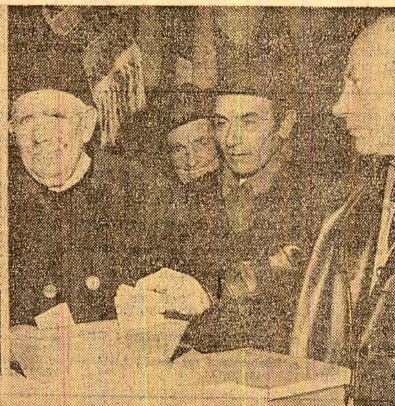
De toate vîrstele, sub semnul împlinirilor prezente și viitoare — la Turnișor-Sibiu