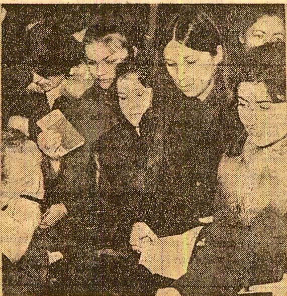
Afluență, exuberanță studențească dar și responsabilitate la urnele de vot din cetatea transilvăneană a științei