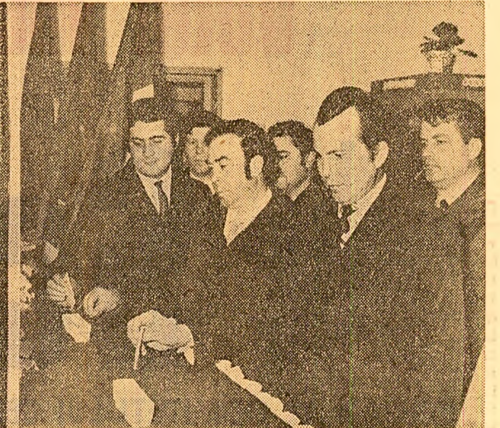
Instantaneu la secția de votare nr. 1 din Circumscripția electorală „23 August”