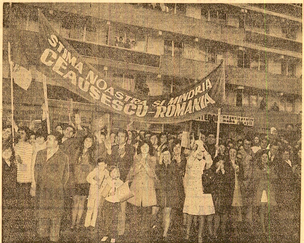
Căldă manifestare de dragoste pentru secretarul general al partidului, pentru conducătorii de partid și de stat