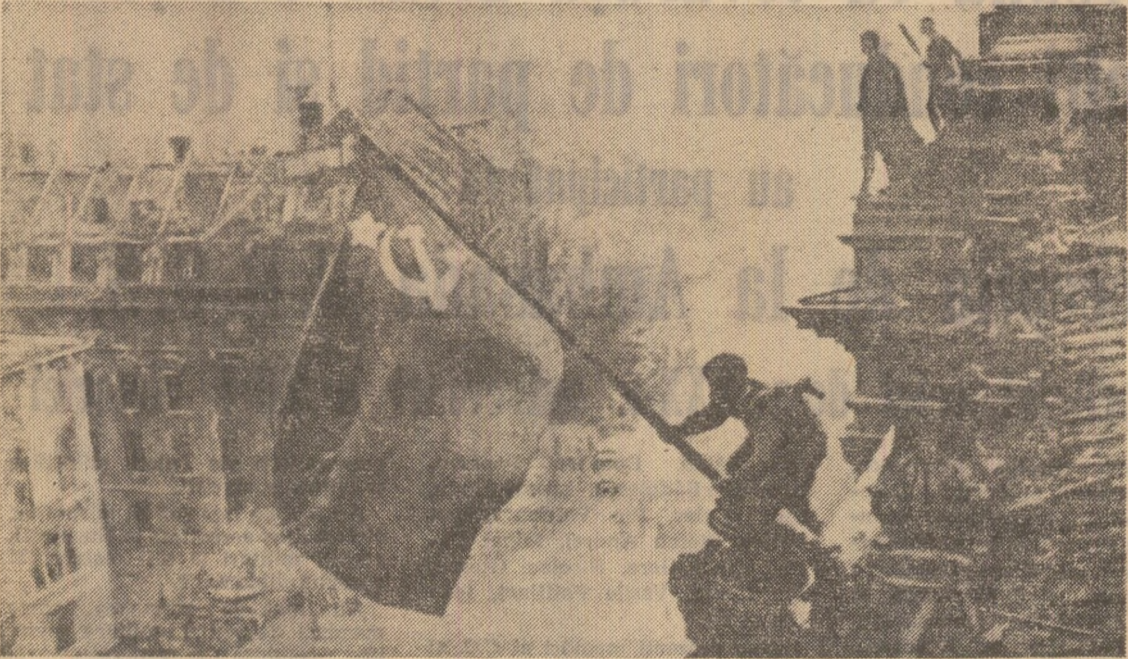
Ostașii sovietici ridicând steagul Victoriei deasupra Reichstagului