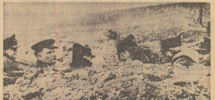
Ofițeri români și sovietici la un post de observație înaintat pe frontul antihitlerist

• Jărănimea a aprovizionat frontul cu circa 220 000 tone produse agroalimentare și 142 000 tone furaje și grîne, la acestea adăugîndu-se un mare număr de vite rechiziționate.