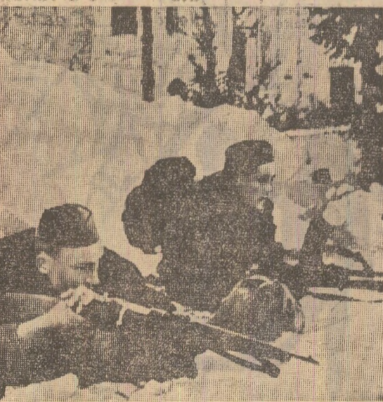
Partizanii iugoslavi în acțiune

În aceste împrejurări grele s-a vădit dărziele poporului englez. Ripostând cu energie, aviația engleză a aruncat în această perioadă peste 14 000 tone de bombe asupra unor obiective militare și economice aflate în stîmba mașinii de război a Germaniei naziste. Hitleriștii au fost siliți să renunțe la planul de invadare a Angliei.