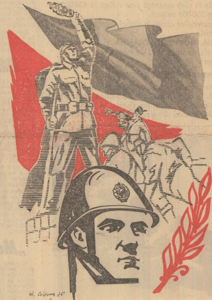
Desen de GH. CALĂRAȘU

Este o sursă de satisfacție pentru poporul român faptul că întreaga (Continuare în pag. a V-a)