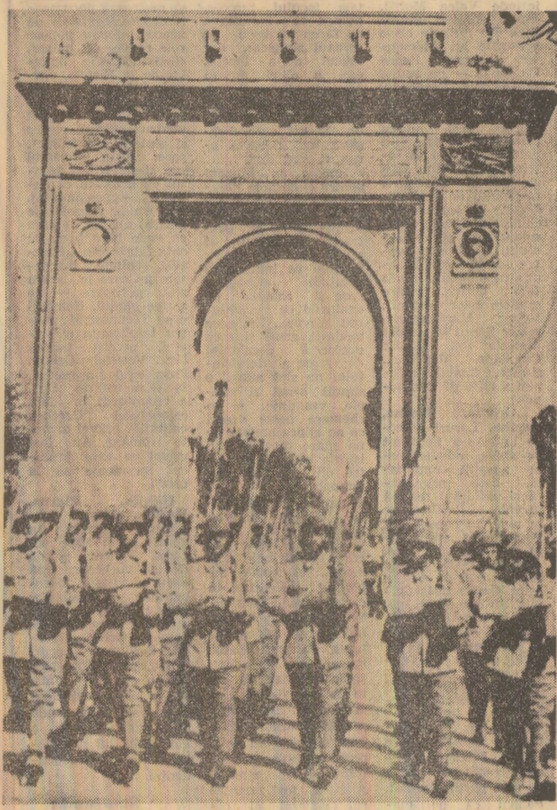
Trupele române trec pe sub Arcul de triumf la reîntoarcerea de pe frontul antihitlerist — 23 August 1944