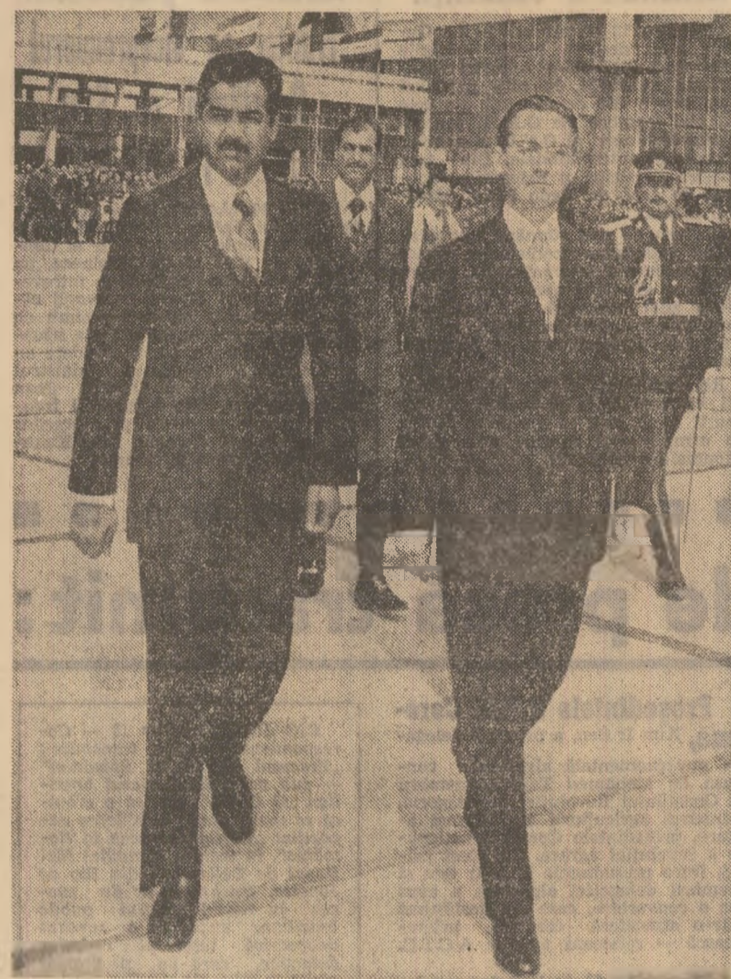
tonată imnurile de stat ale celor două țări. O gardă militară a prezentat onorul. Numerosi cetățeni ai Capitalei aflați pe aeroport, precum și liderii irakieni care studiază în țara noastră au salutut cu căldură pe secretar general adjunct al Conducerii regionale a Partidului Socialist Arab Baas, vicepreședintele Consiliului Comandamentului Revoluției din Republica Irak, tovarășul Saddam Hussein. (Agerpres)