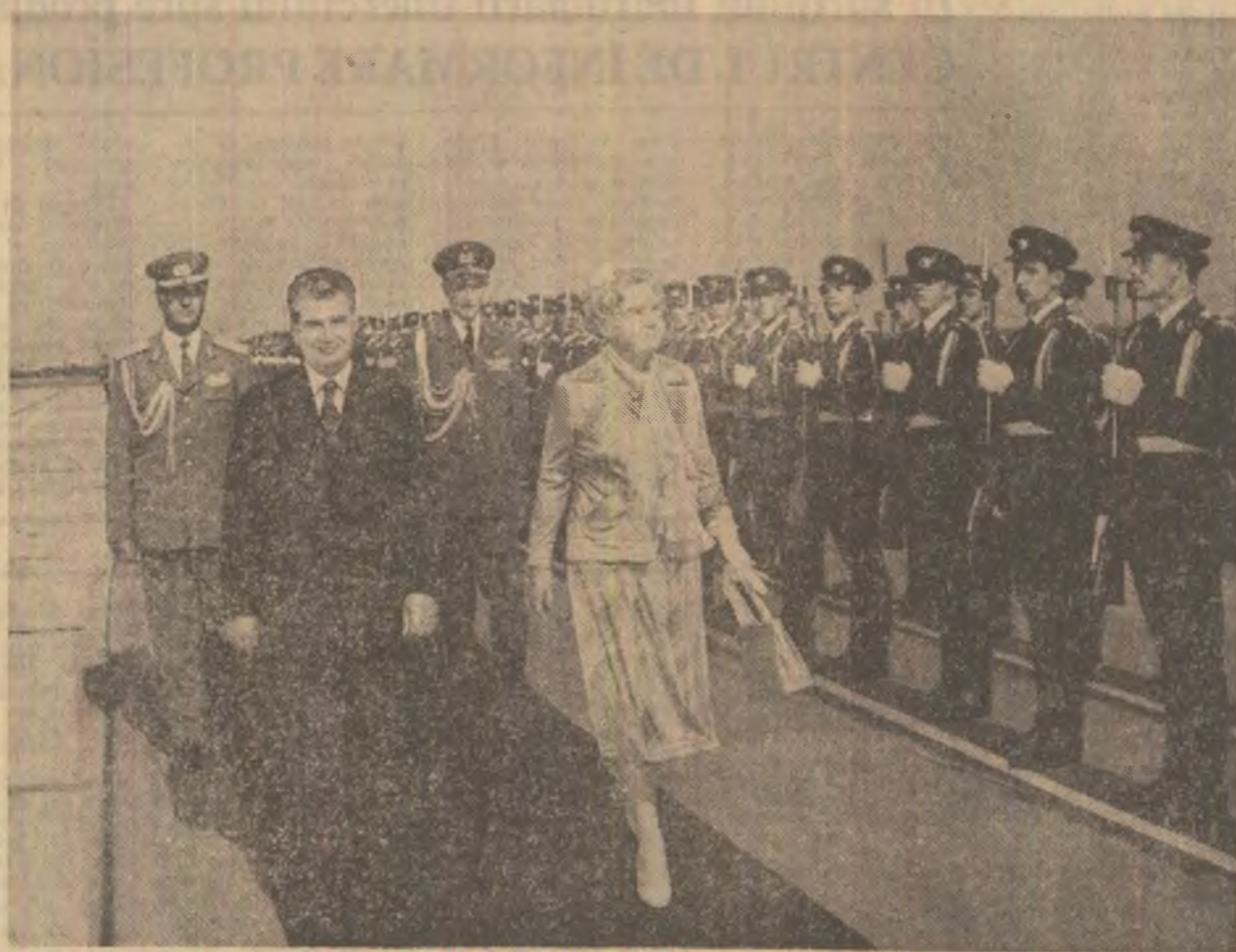
La sosire, pe aeroportul Otopeni