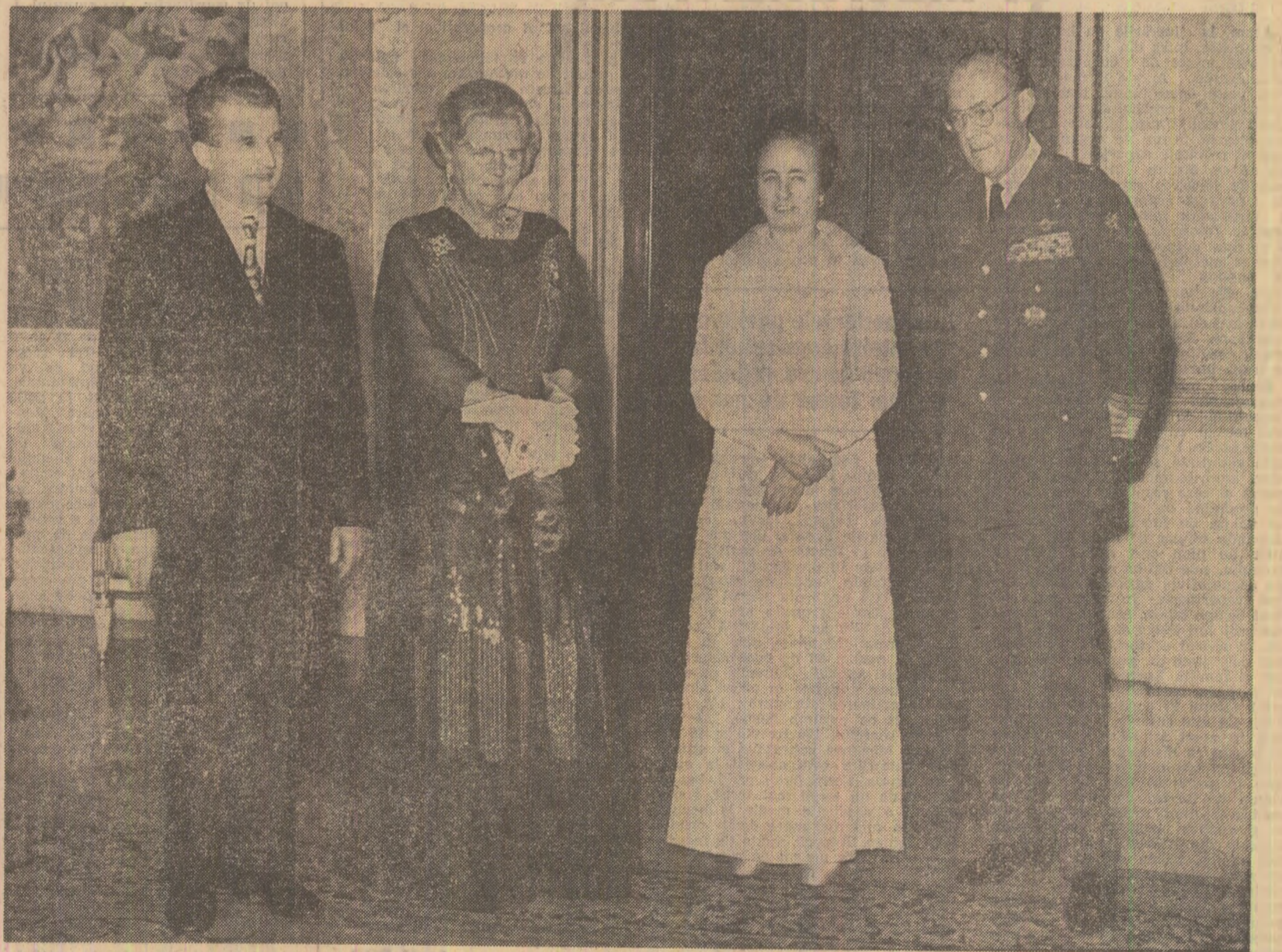
Înălțea dineului oficial