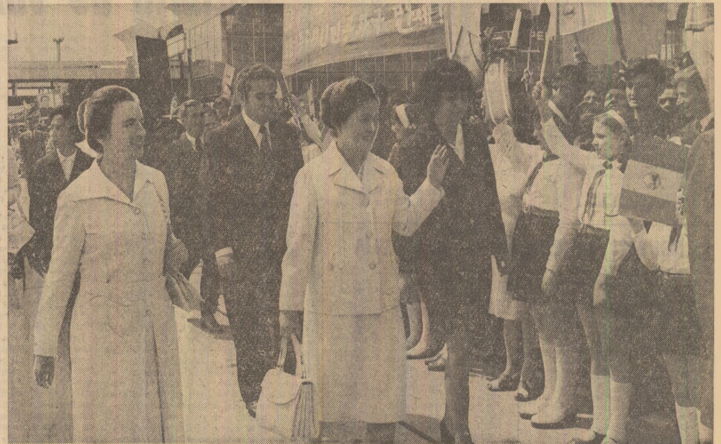
La sosirea pe aeroportul Otopeni