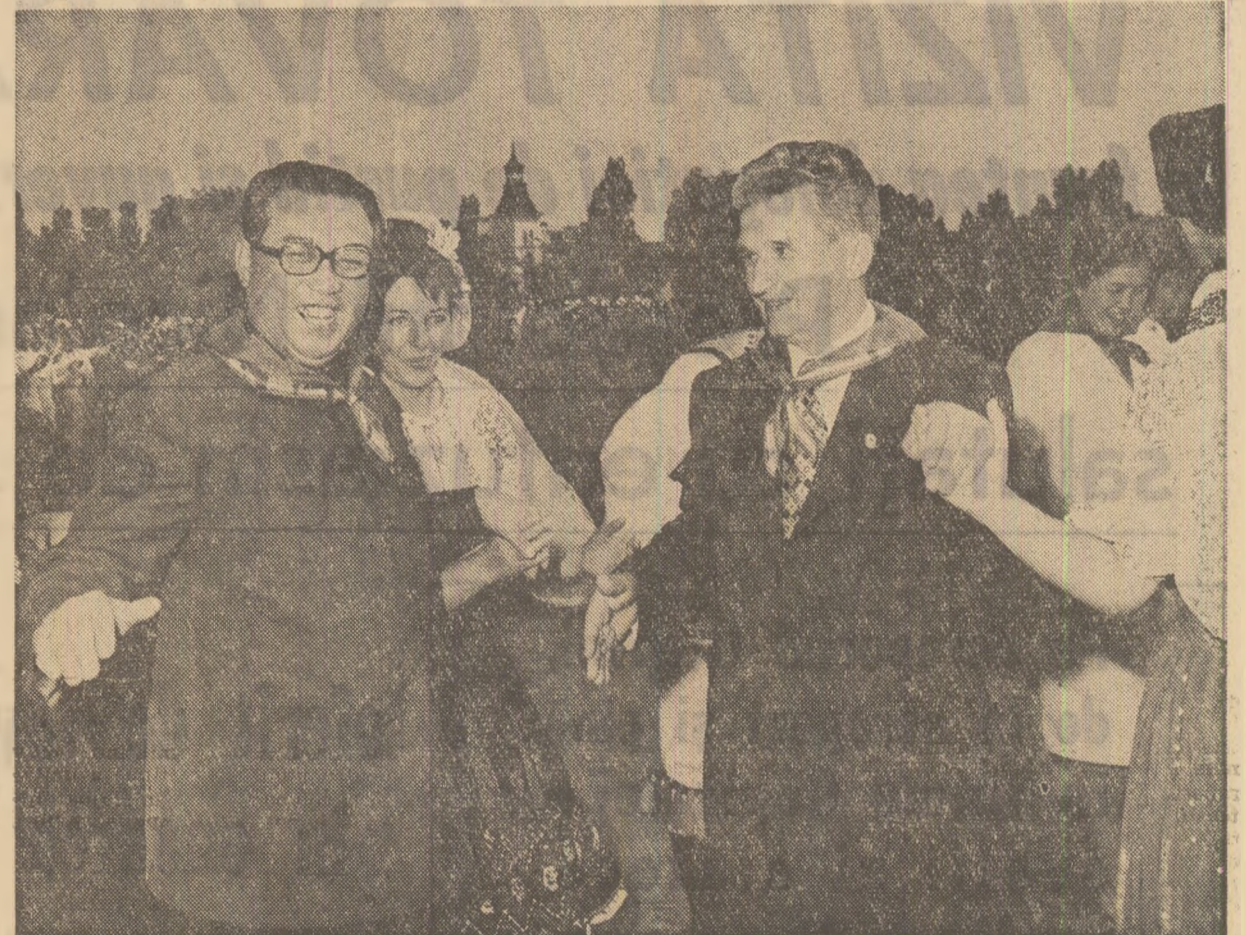
În hora prieteniei frățești