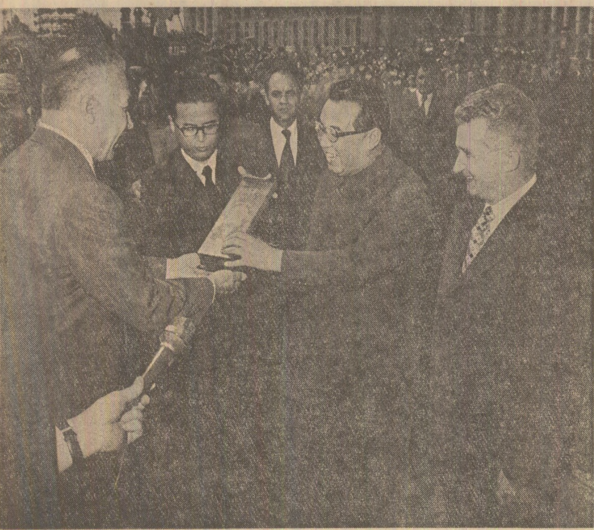
Omagiu către înaltul sol al poporului coreean: înmînarea „Cheii orașului București”