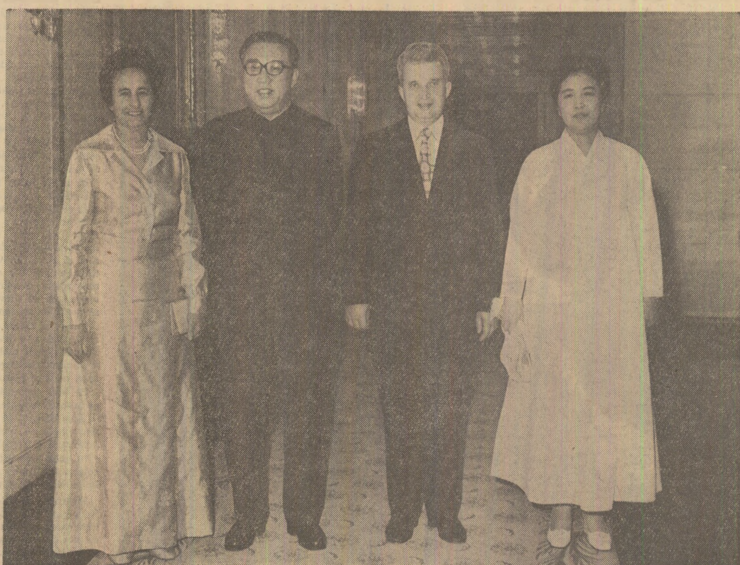
În timpul dîneului oficial