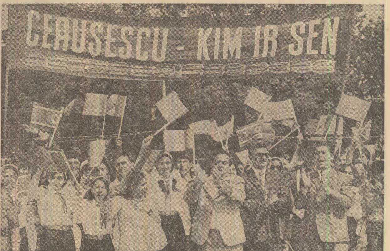
Pretutindeni, manifestații entuziaste, ovații și urale