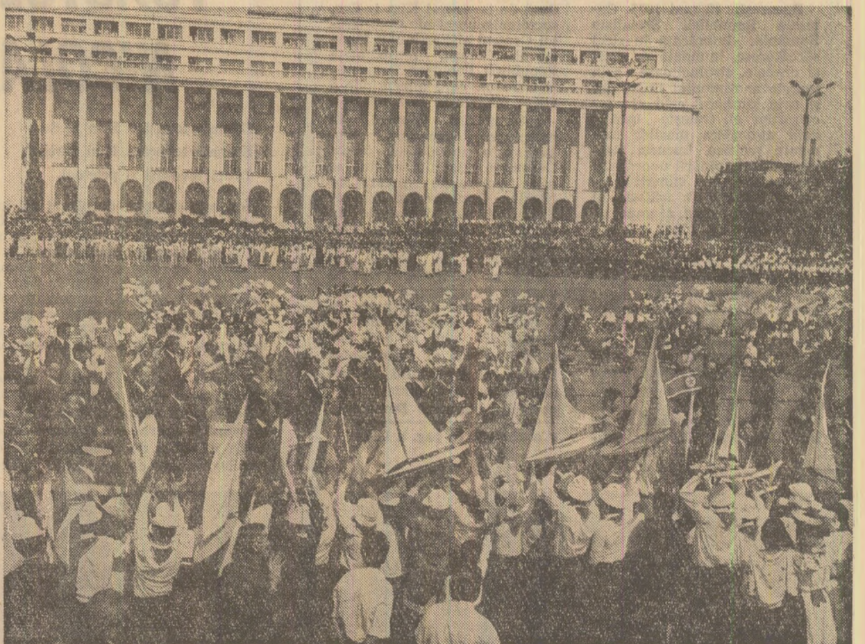
Însuflețită demonstrație coregrafică a pionierilor consacrată prieteniei româno-coreeană