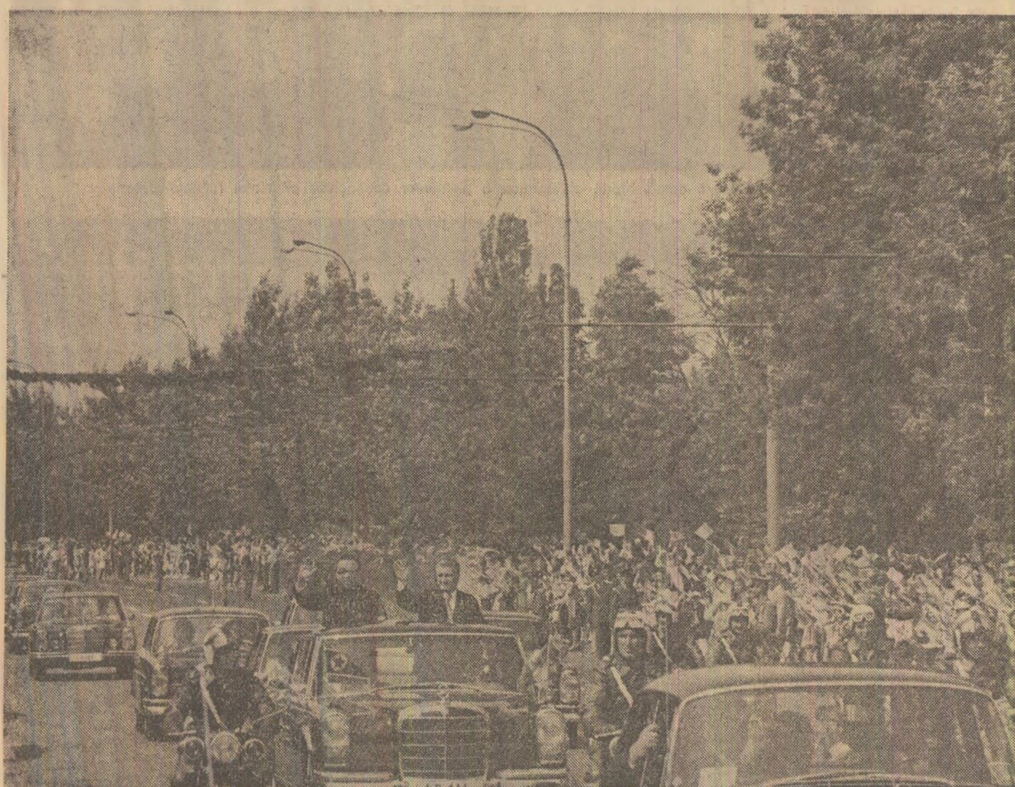
Sute de mii de cetățeni au salutat pe președinții Nicolae Ceaușescu și Kim Ir Sen de-a lungul itinerarului