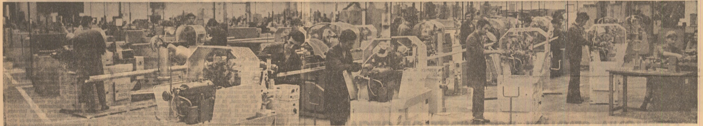
Noua întreprindere bucureșteană „Conect”

și a orientărilor pe care le-ați trasat pentru punerea lor în valoare, pentru accelerarea progresului societății românești și ridicarea continuă a nivelului de trai al poporului. Tocmai de aceea, noi, comunistii, toți oamenii muncii legăm indisolubil aceste rezultate, cele mai rodnice din întreaga istorie a construcției socialiste în România, de numele dumneavoastră, de activitatea neobosită, insuficientă de înaltă responsabilitate față de destinele poporului român, pe care o desfășurați cu atita dăruire în fruntea partidului și statului nostru. Indicațiile dumneavoastră prețioase au orientat în permanență activitatea organelor și organizațiilor de partid din Capitală, determinând creșterea continuă a rolului lor în