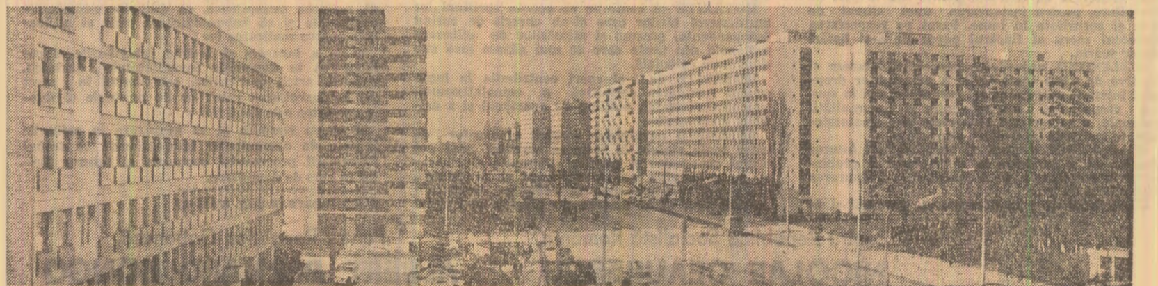
Azi, în cartierul Pantelimon din Capitală