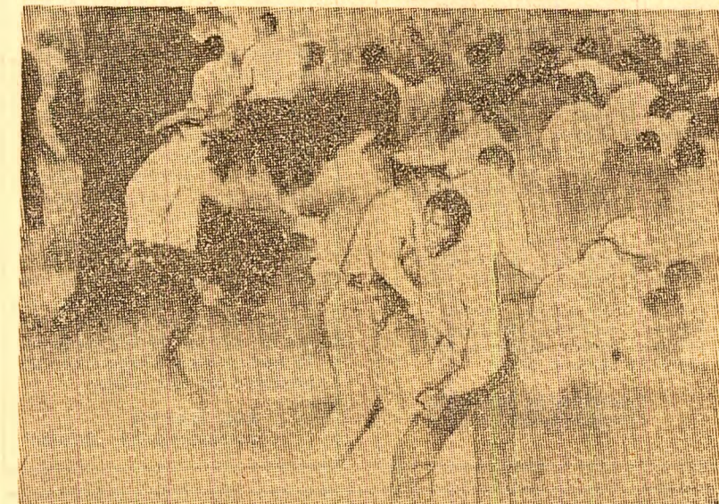
Poliția din Salisbury (Rhodesia) reprimă o demonstrație pașnică a populației de culoare.

funcțiune al actualei Conferințe la nivel înalt a țărilor nealiniate, în care se cere oficial admiterea R.D.V. în grupul țărilor nealiniate. Mesajul a fost dat publicității integral în capitala Algeriei.