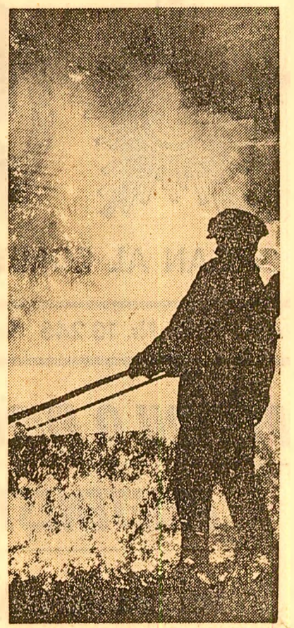
Se elaborează o nouă șarfă la Combinatul siderurgic Hunedoara

• o serie de măsuri vizează eliminarea unor neajunsuri în domeniul folosirii integrale a deseurilor recuperabile, proiectării unor reperi și aplicării de noi tehnologii în prelucrare. În această privință organizația de partid și-a propus să mobilizeze mai intens cadrele de specialiști și să controleze îndeaproape cum este îndeplinit programul de măsuri tehnice și organizatorice pentru diminuarea consumurilor materiale întocmit în întreprindere.