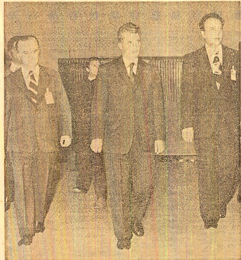
La sosirea în sala de ședințe

Din cuvîntările participanților la lucrările conferinței ÎN PAGINA A III-A