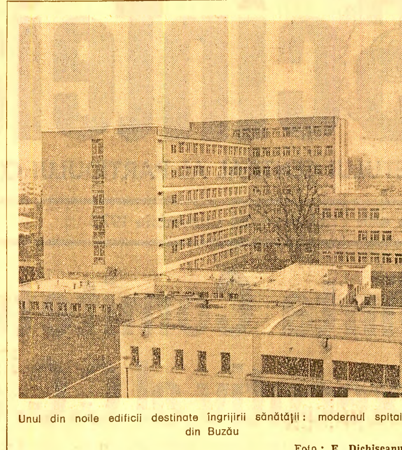
Unul din noile edificii destinate îngrijirii sănătății: modernul spital din Buzău.

de metodele „verificate”, care nu cer o angajare în plus o muncă în plus. Acestea sînt cerințe ale autenticului spirit revoluționar. Atomul marcat” al revoluționarului este recunoscut în acea stare de neîncredere creatoare, oricît de modest este locul lui de muncă, pentru căutarea noului, promovarea lui, desprinderea de practici rutiniere. Cu alte cuvinte, răcorul firese la marea și complexul flux de muncă, de perfecționare ce străbate întreaga noastră națiune. Ca vibrant moto la aceste îndatoriri morale ale comunistului, de a dovedi curaj și inițiativă în lupta pentru promovarea spiritului revoluționar peste tot, pot fi așezate cuvintele tovarășului Nicolae Ceaușescu rostite la ultima plonară: „Trebuie să aflăm noi formule pentru ridicarea nivelului politico-ideologic al comunistilor, al activului de partid, pentru crearea unui mai puternic spirit de răspundere, de sacrificiu”, activitatea de revoluționar de comunist, care o asemenea spirit. Numai prin aceasta se deosebesc, până la urmă, comunistii, revoluționarii, de ceilalți cetățeni! Să acționăm ca acest spirit să pătrundă tot mai adînc în viața partidului, a fiecărui activist și a fiecărui membru de partid!”