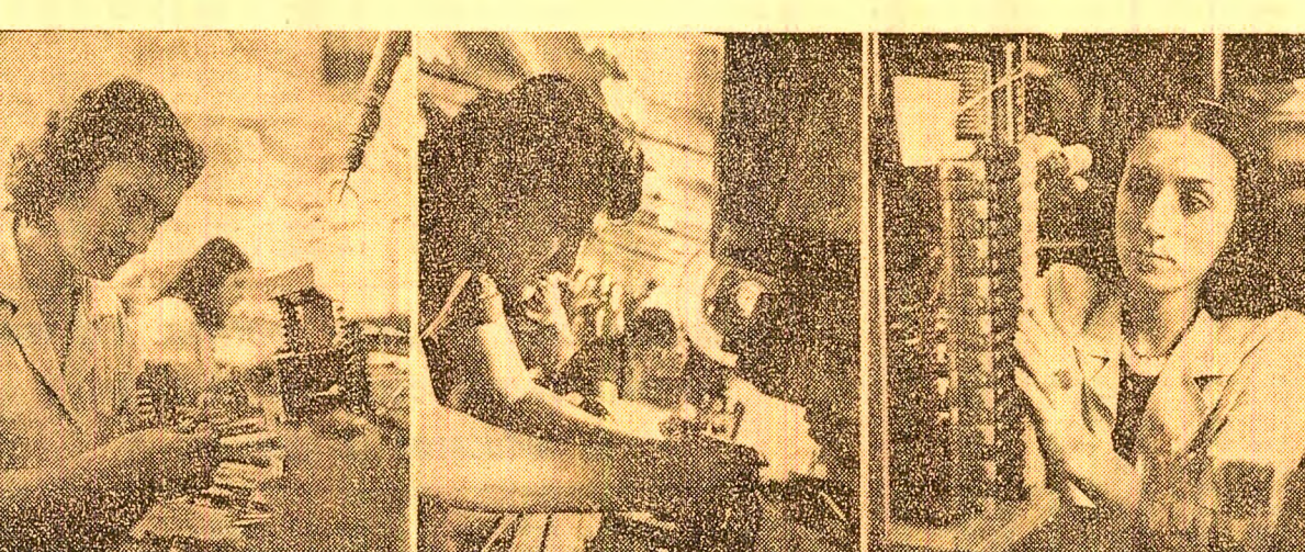
(Urmare din pag. 1) vor decide cînd să înceapă sămînța.

Cuvîntul dat trebuie onorat! Aceasta este hotărîrea luată la începutul anului la întreprinderea bucuresteană „Electromagnetica”. Printre altele, în marea întrecere socialistică colectivul de muncă de aici s-a angajat ca în acest an să realizeze, suplimentar, aparatură de telecomunicații și mijloace de automatizare în valoare de 32 milioane lei. În opt luni, la acest capitol, depășindu-se ritmul de 60 milioane lei. Așadar, cuvîntul dat este respectat! Graficele întrecerii continuă lînsă să înregistreze, în fiecare zi, cote tot mai înalte. Și aceasta în condițiile unei eficiențe economice superioare. Dovadă: în perioada amintită prevederile de plan privind creșterea productivității muncii au fost îndeplinite în proporție de 101,8 la sută, au fost reproductate, modernizate și introduse în fabricație 10 produse peste cele prevăzute în plan. Aceste succese au fost obținute îndeosebi pe seama perfecționării unor