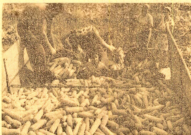
Cînd toți pun mina, porumbul din lanuri ajunge repede în magazii proprii și la baza de recepție. Imagine obișnuită de muncă pe terenurile cooperative agricole Șteubi-Orăști, județul Ilfov