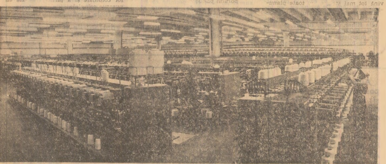
Întreprinderea de fire și fibre sintetice — Iași. Aspect din noua și modernă secție de fibre nr. 2.

Acasă puternică dezvoltare a acțiunii de economisire s-a realizat în cadrul creșterii continue, într-un ritm înalt, a veniturii naționale, implicit și a veniturii populației, al prosperității naționale, al ridicării nivelului înalt al cetățean. Astfel, în perioada 1971—1975, retribuirea reală crește cu 22 la sută, iar veniturile reale ale țării provin din producția agricolă, calculate pe o persoană activă, cu 35 la sută. La finele anului 1975, după aplicarea