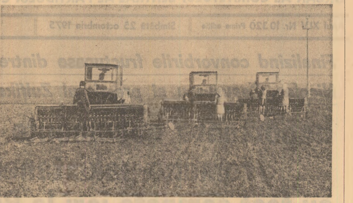
Pe terenurile cooperativei agricole din comuna Pituru, județul Dimbovița, se însemnează ultimele hectare cu grîu.