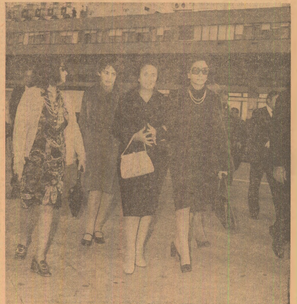
Pe aeroportul internațional Portela

La ora 11,30 (ora locală) aeronava prezidențială decolează, îndreptîndu-se spre patrie. (Agerpres)